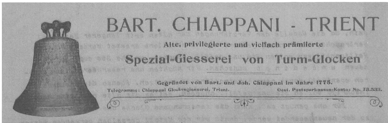
Abb. 3: Briefkopf der Giesserei Bart. Chiappani.

einmal eine weitere Reise nach Gries bei Bozen, wo Chiappanis berühmtes 10er-Geläut von 1895, erneut samt dem Architekten Rimli, angehört werden sollte. Aufgrund der Vielstimmigkeit konnte man sich dort gleich mehrere mögliche Tonfolgen und gar das theoretische Zusammenläuten aller Nachbarkirchen bei Kreuzlingen vorführen lassen, wobei Letzteres in Wahrheit nicht möglich war, weil das Geläut keine d'-Glocke enthielt. Wie auch immer habe namentlich „die schwere Glocke As-Glocke durch ihren majestätischen Klang wie eine Königin alles beherrscht“. Dennoch sprach sich der Präsident eher für die kleine Variante auf des' aus, allenfalls für dieselbe h°-Kombination wie in Lustenau, welche schliesslich auch in der Kommission eine klare Mehrheit fand und der Gemeinde empfohlen wurde. Amüsant ist in der ganzen Geschichte, dass die Kommission die Geläutemotive geradezu untrennbar mit der offerierenden Giesserei verkettete, als hätte z.B. Rüetschi die von Chiappani eingebrachten Kombinati-