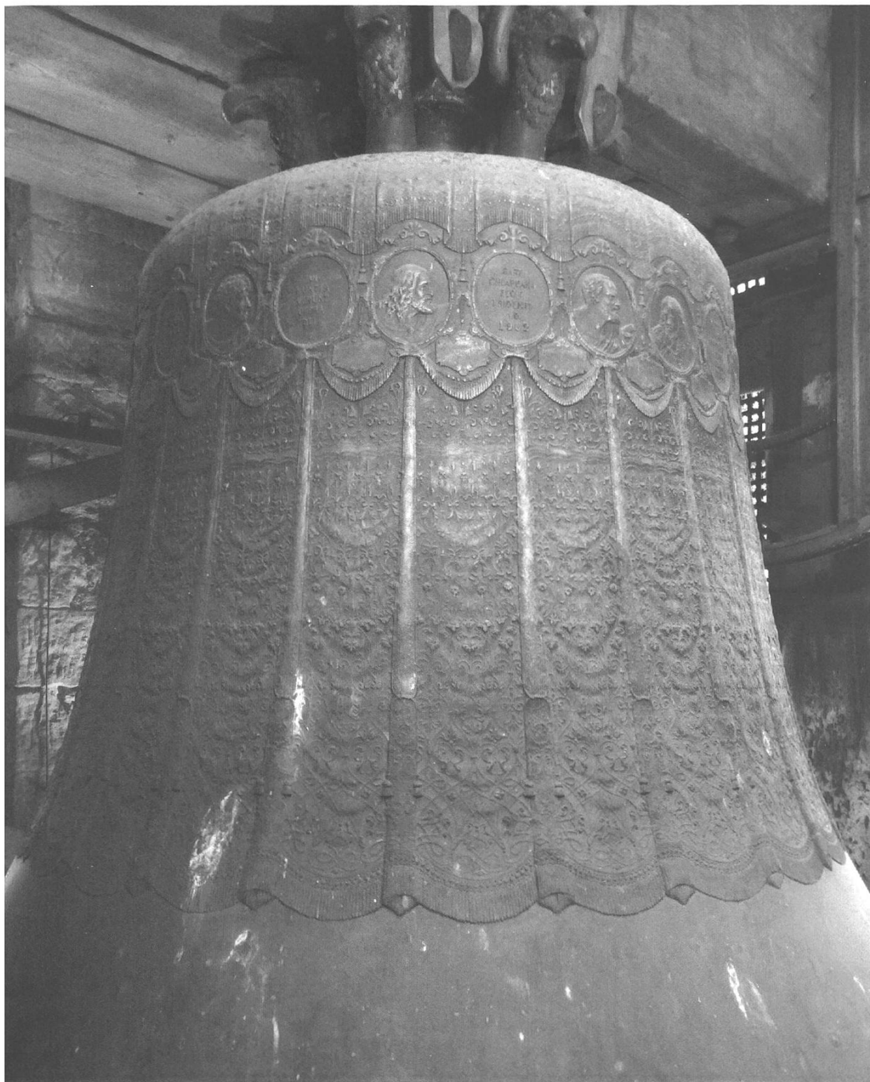
Abb. 2: Kreuzlingen-Emmishofen, Marienglocke (Nr. 2, Ton cis') von 1902 (Karl und Guido Chiappani). Noch mehr als andere Giesser des Fin-de-Siècle prunkte Chiappani mit individuellem, fast die gesamte Glocke übersäenden Ornamentschmuck, der oft bestickte liturgische Textilien nachahmte.

macht. Die Emmishofer Baukommission sollte daher nach Lustenau reisen