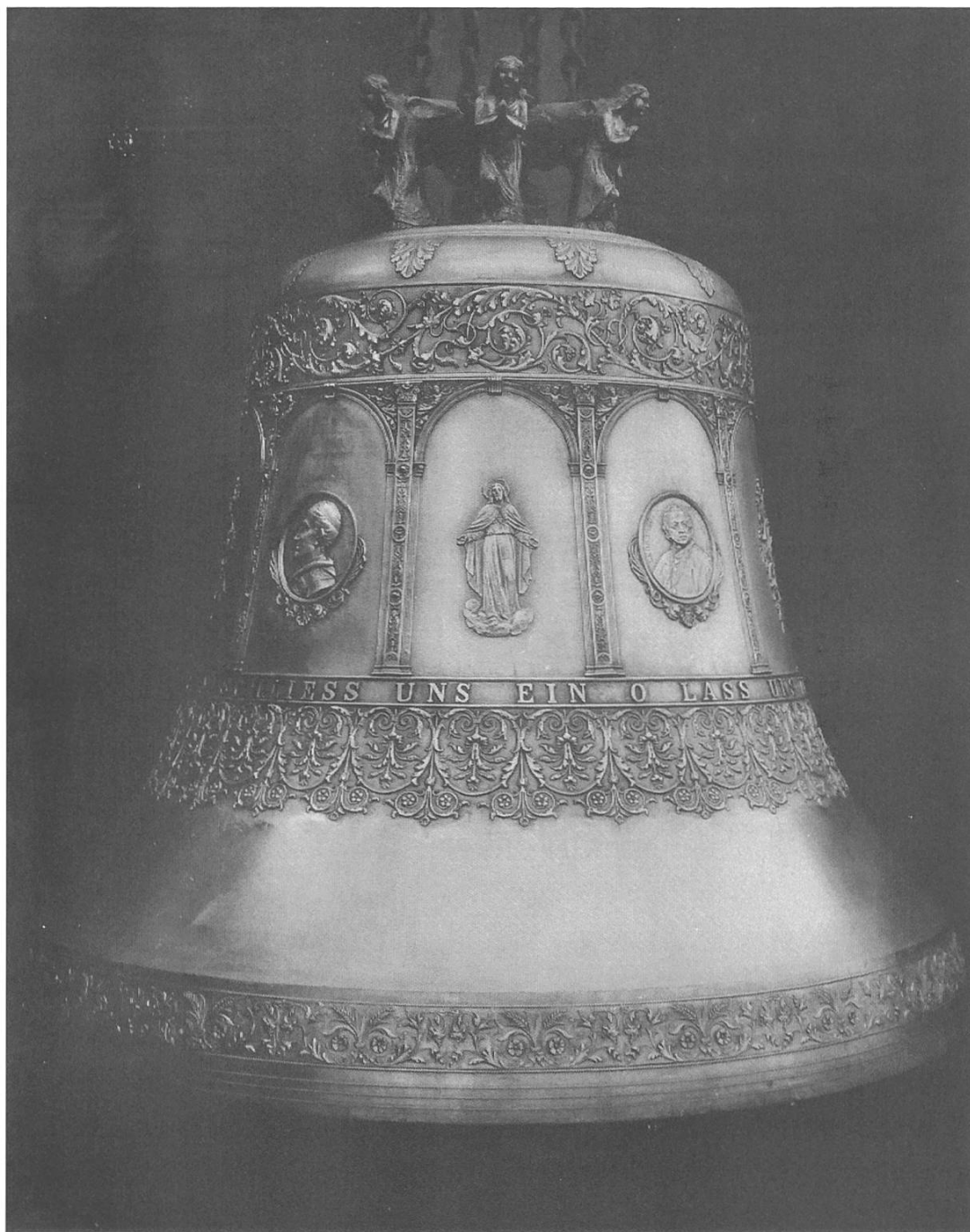
Abb. 4: Kreuzlingen-Emmishofen, Herz-Jesu-Glocke (Nr. 1, Ton h o ) von 1902 (Karl und Guido Chiappani), gesprungen und ersetzt 1911. – Foto 1902, Kirchgemeindegarchiv.

um ein entsprechendes Stück Bronze gebeten zu haben, um die „Unglücksglocke“ zu retten. Der Giesser verhehlte seine Entrüstung nicht: „Was fällt Ihnen ein, Glocken mit Eisenbahnschienen u. dgl. zu vergleichen?“ Dennoch scheint ein Schweiss-