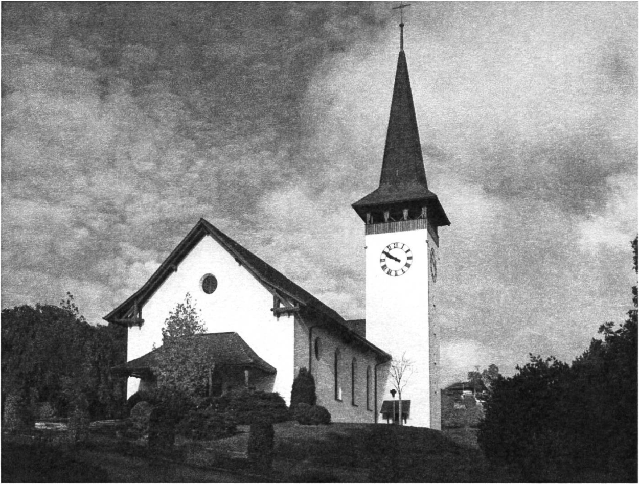
Abb. 1: Die Kirche Uetendorf. – Foto: Autor, 2018.