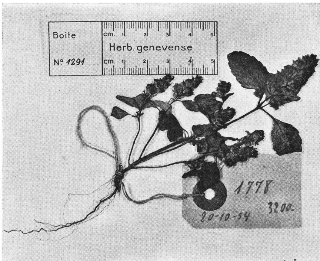
FIG. 2. — Elsholtzia concinna Vautier, spec. nov.; type Zimmermann 1778, G

Annua, coarctata e basi ramosa, 6-11 cm. alta. Inflorescentia spiciformis, conica, rami laterales minores, 25-30 mm. longa, 12-16 mm. lata. Folia ovata, limbus