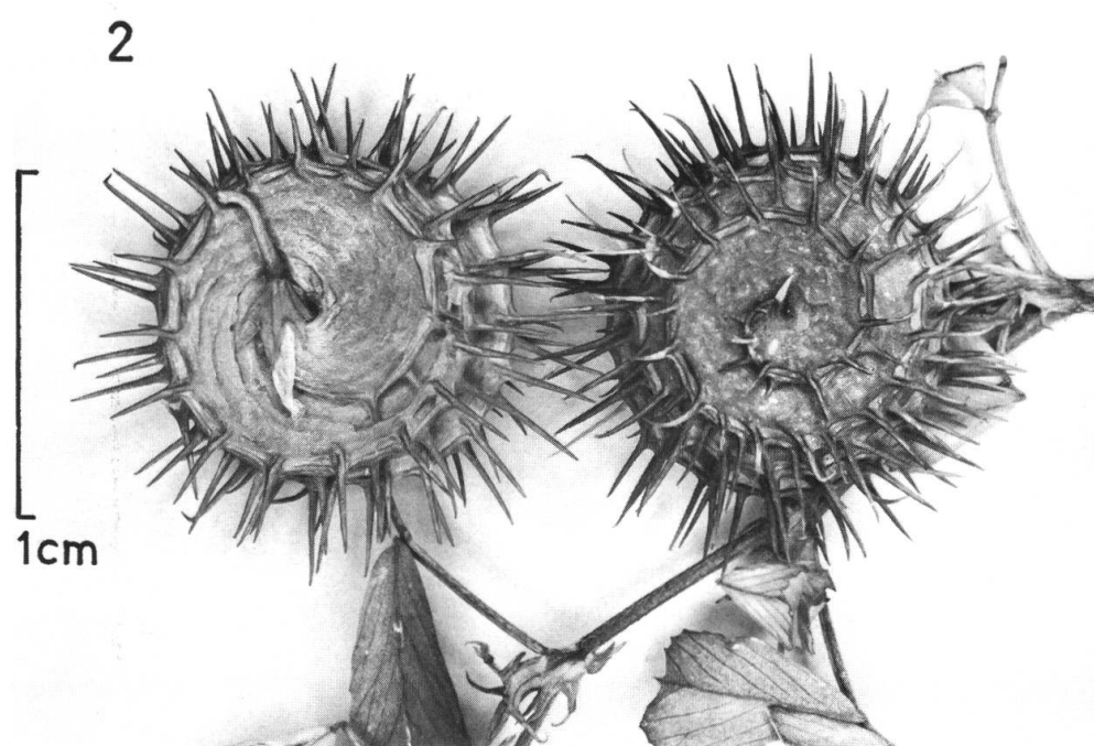
Fig. 1-2. — Medicago Heyniana Greuter, échantillon-type et détail montrant les fruits.