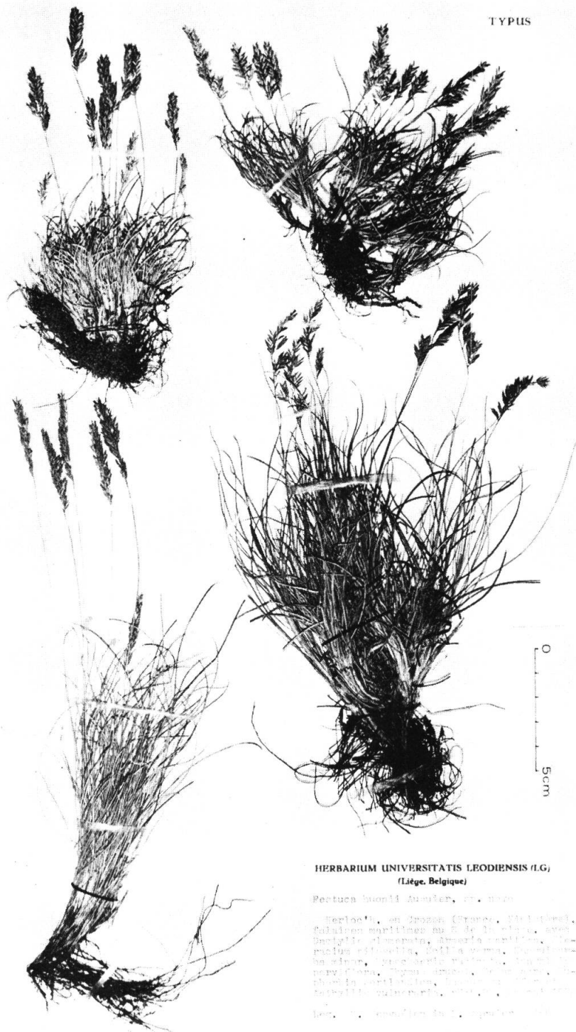
Festuca huonii Auquier: typus (Kerloc'h, près Crozon, Finistère, Kerguélien in Auquier H 790).