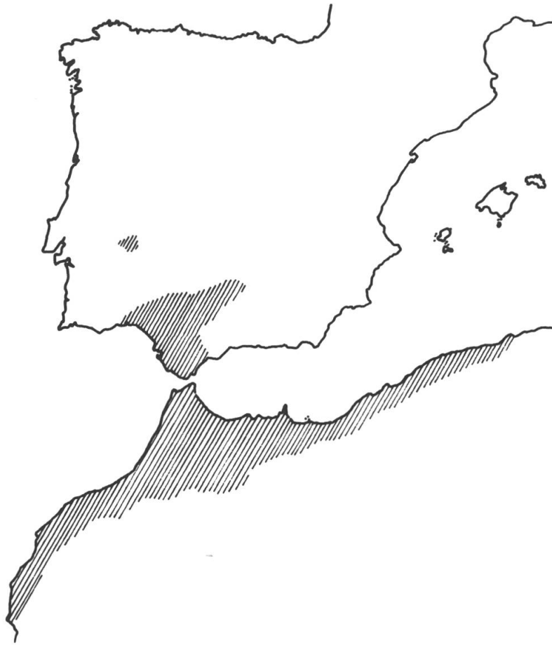
Fig. 2. — Distribution générale approximative actuellement connue du Braxireon humile (Cav.) Rafin.

(SEV); ibid. : environs de Utrera, sur sol argileux, 7.10.1972, E. Domínguez, S. Silvestre & B. Valdés 2210 ; ibid. : Universidad Laboral, 4.10.1976, Cabezudo, D. Müller-Doblies & Talavera 2142 (SEV); ibid. : Alcalá de Guadaira, río Guadaira, 4.10.1976, Cabezudo, D. Müller-Doblies & Talavera 2149 (SEV); ibid. : entre Alcalá de Guadaira y Morón de la Frontera, 4.10.1976, Cabezudo, D. Müller-Doblies & Talavera 2152 (SEV). Maroc . Casa Topillevada, 1928, Vidal López 22500 (MA); hab. in callitrietis degradatis promontorii Ras Sidi-el-Ahbed (Bocoia), 150 m alt., fl.: 20 sept., fr.: 10 déc. 1928, Font Quer 22502 (MA); Taguilmanin, à la base du Gurugú, 24.10.1930, Hno. Mauricio 22501 (MA).