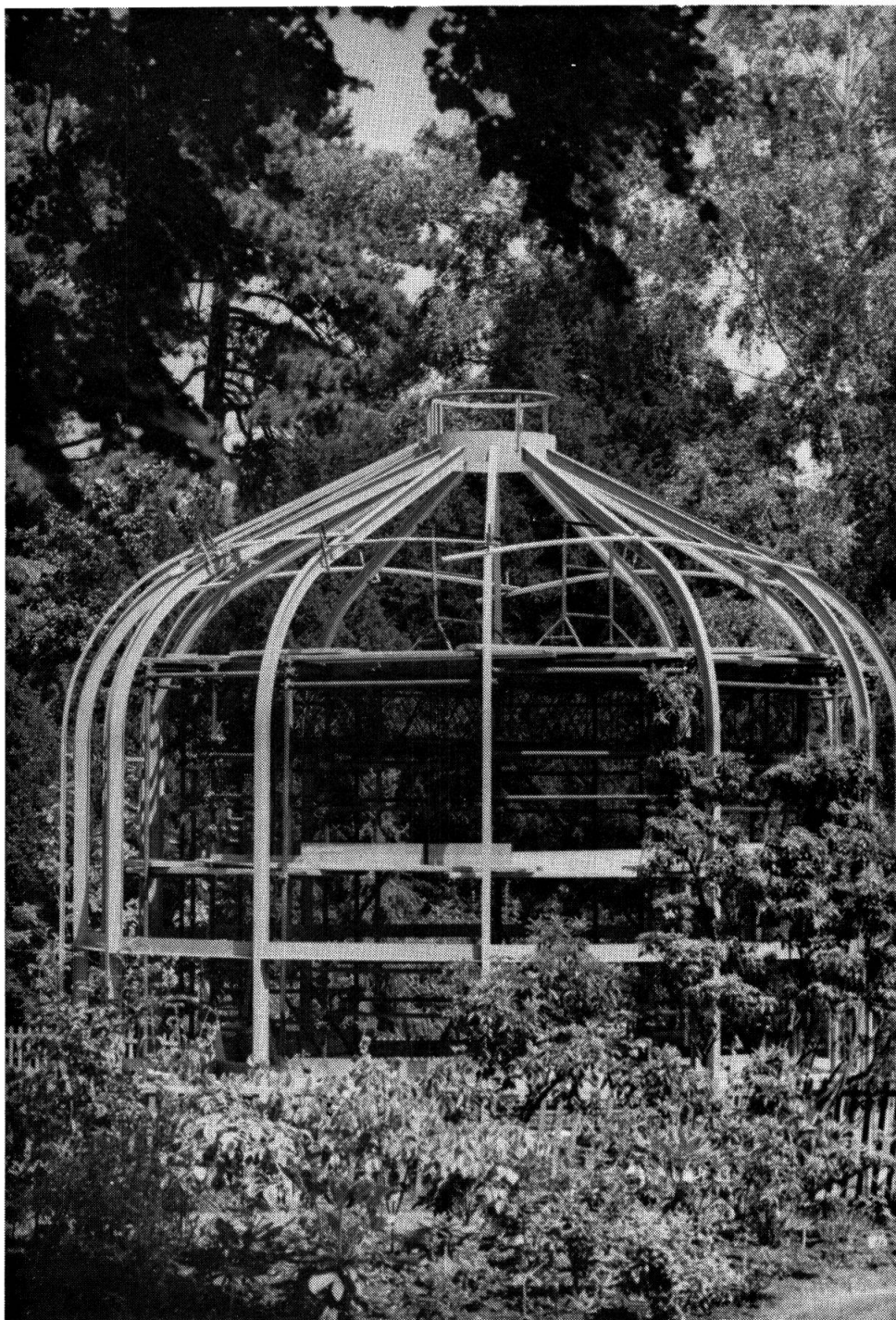
Construction de la serre-volière.