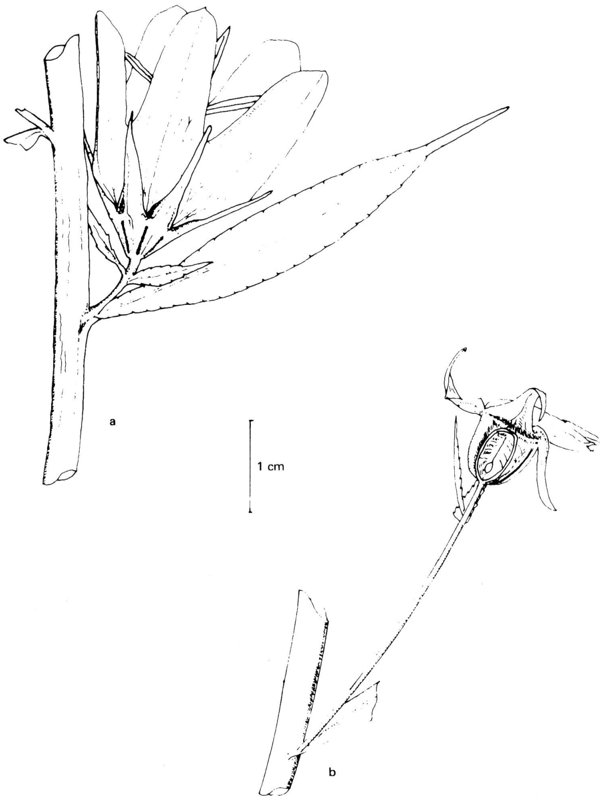
Fig. 1. — The flower and the capsule of Campanula latiloba A. DC. subsp. rizeensis A. Güner. A, flower (2 ×); B, capsule (2 ×).