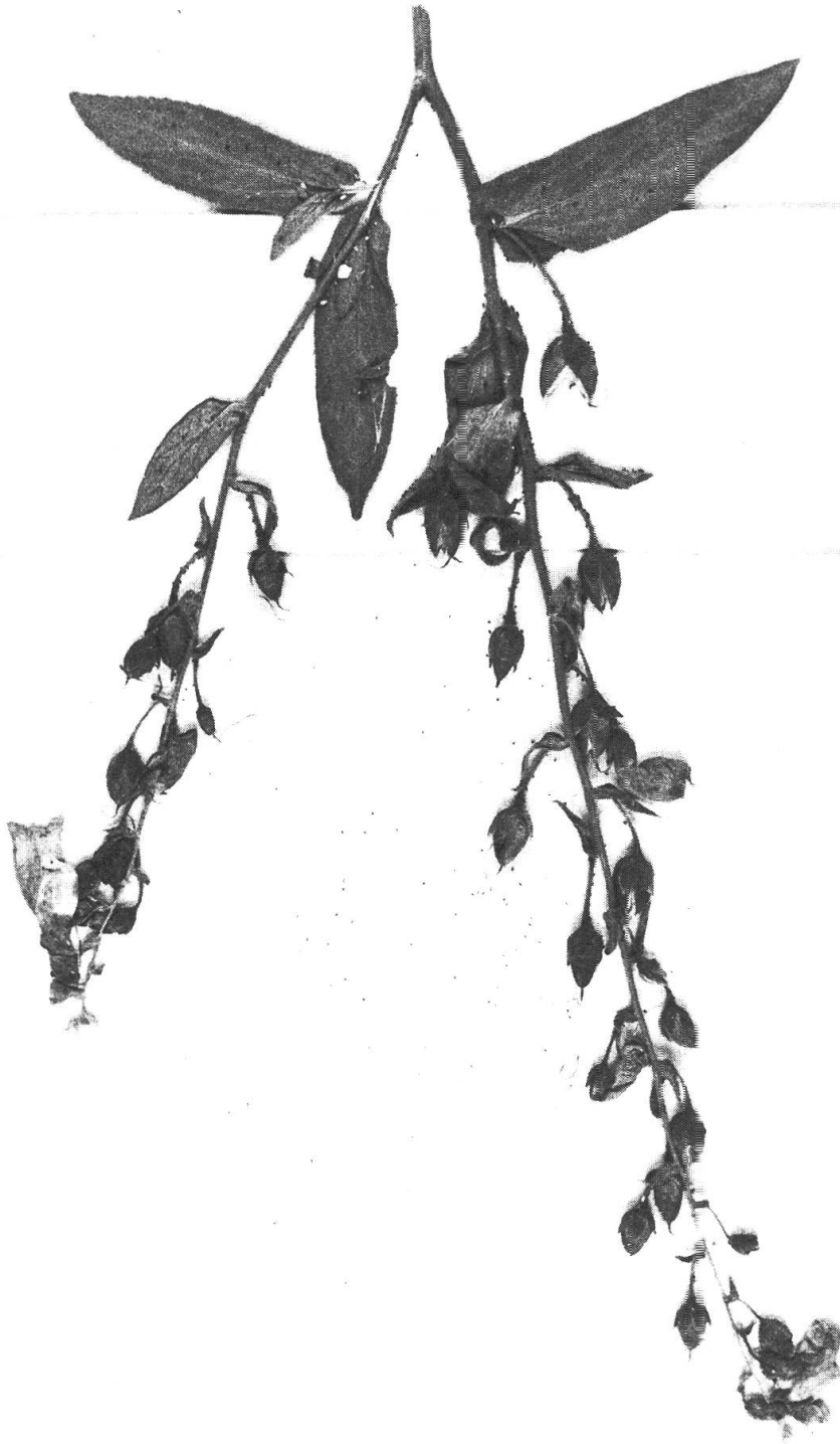
Fig. 2 (pages 188-189). — Néotype du Digitalis thapsi L.