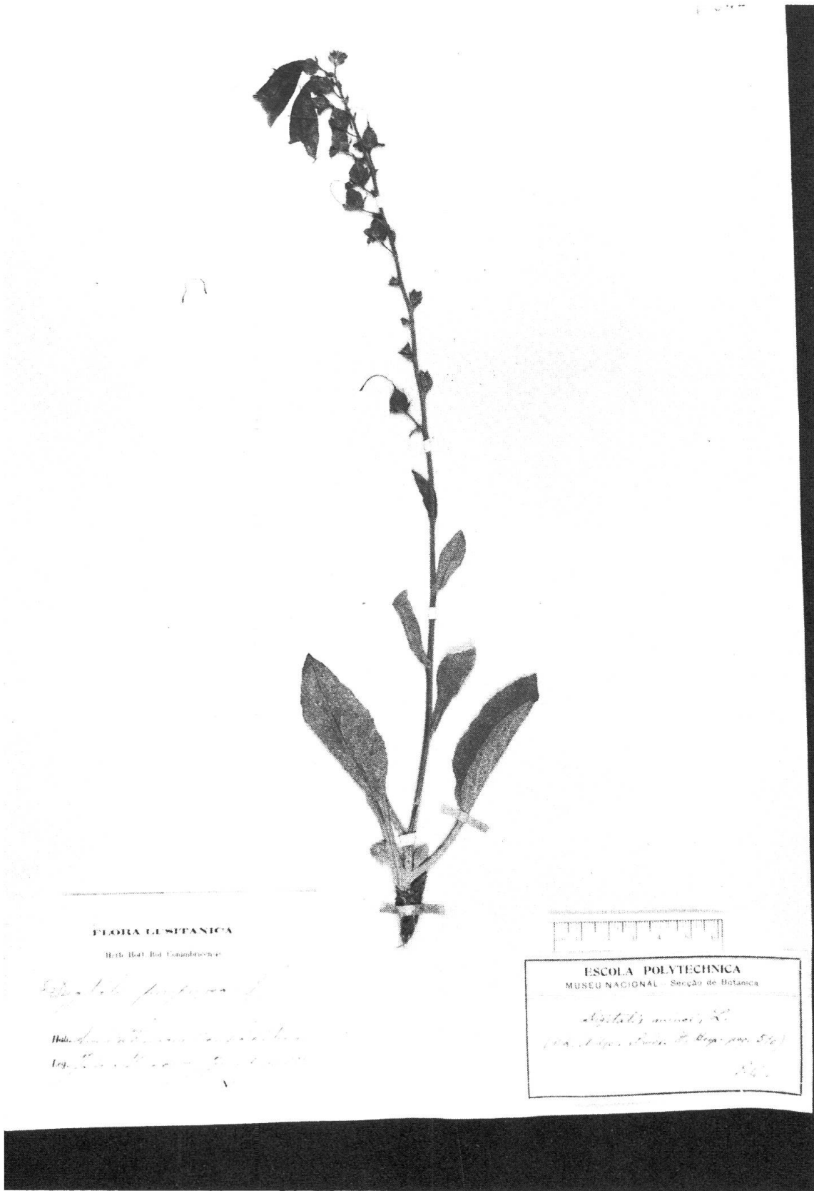
Fig. 5. — Echantillon de l'herbier de Lisbonne (LISU) annoté D. minor L. (= D. purpurea L. × D. thapsi L.).