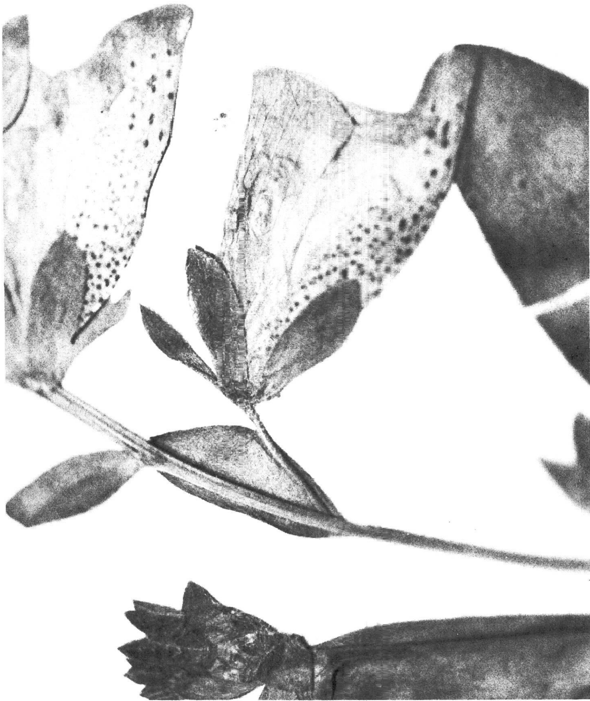
Fig. 1. — Lectotype du D. minor L. (LINN 775.2) Détails des fleurs: en haut à gauche la forme des sépales et les pétales latéraux découpés.