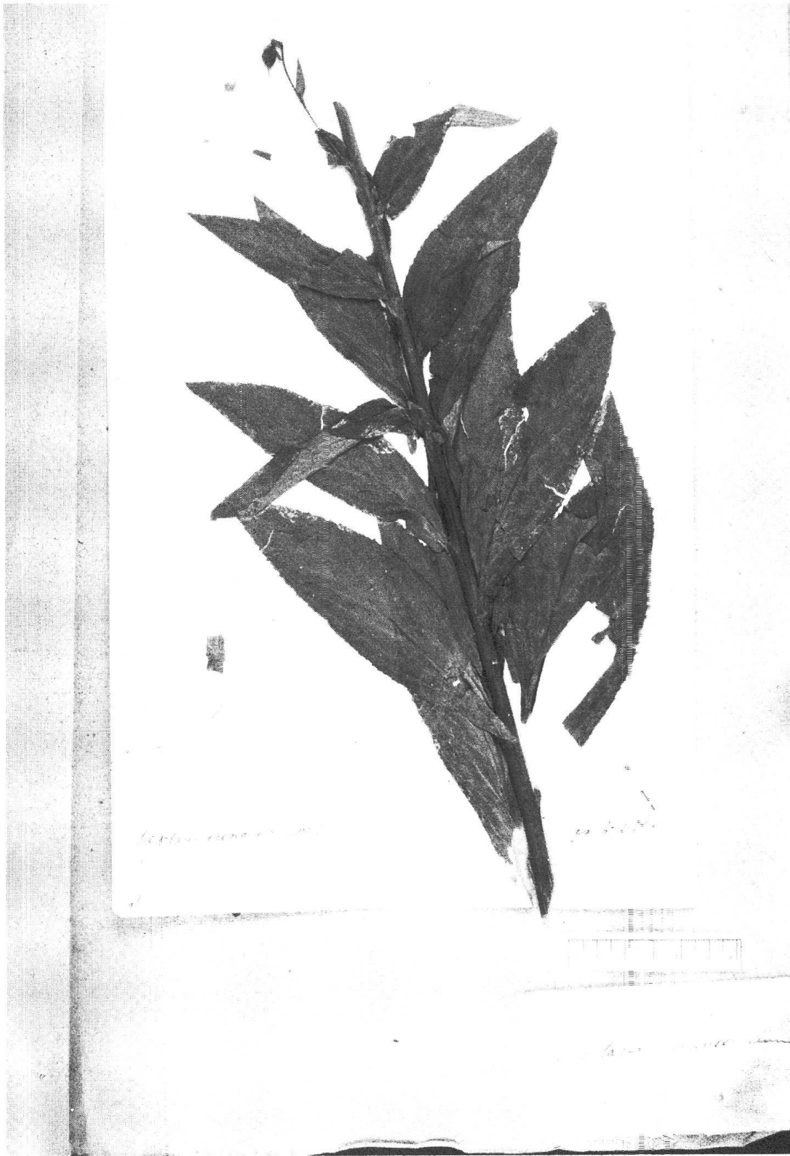
Fig. 3 (pages 198-199). — Echantillon de l'herbier De Candolle (G-DC) annoté D. minor L. (= D. purpurea L. × D. lutea L.).