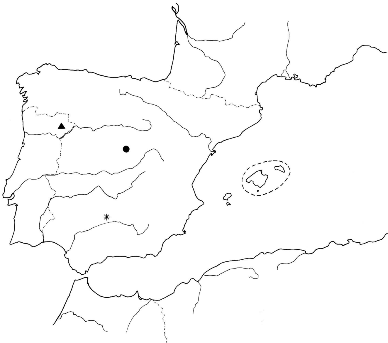
Fig. 6. — Localités des échantillons considérés comme D. minor L.