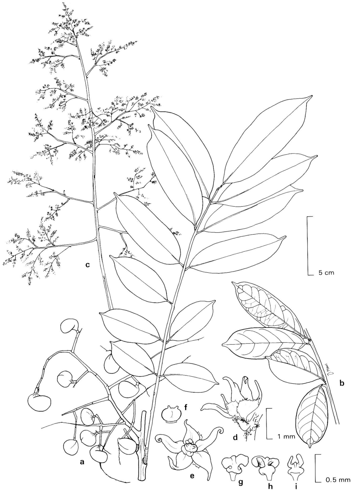
Fig. 1. — Ophiocaryon heterophyllum (Benth.) Urban a) ramita e infructescencia; b) folíolos; c) inflorescencias; d, e) vistas diferentes de la flor; f) ovario; g) estambre, cara externa; h) estambre, cara interna; i) cara interna del estambre con las anteras abiertas.