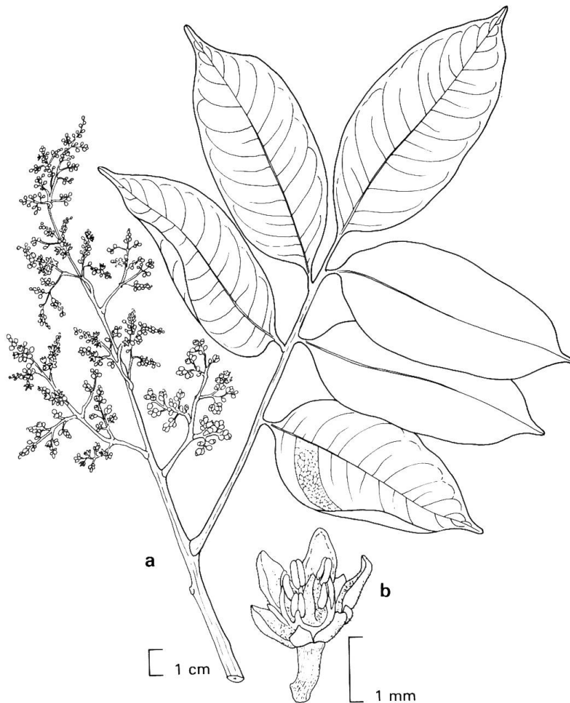
Fig. 4. — Thyrsodium herrereense Encarnación (árbol 2/100) a) ramita terminal e inflorescencias; b) flor.

de alto. Cáliz gamosépalo, cupuliforme. Pétalos soldados en la parte inferior. Estambres 5, filamentos soldados entre sí por la base. Pistilodios. Flores ♀ y fruto no observados.