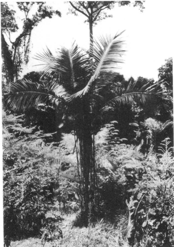
Fig. 1. — Astrocaryum triandrum . Hábito.