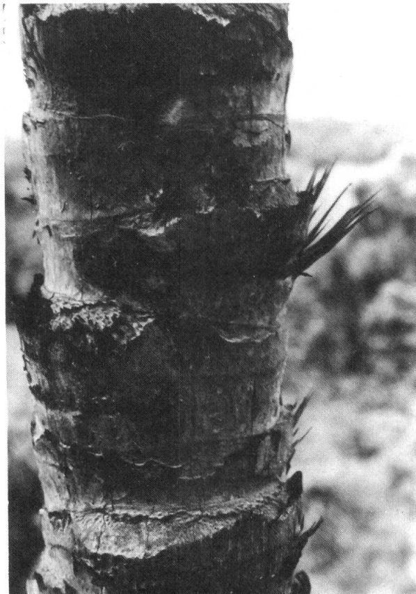
Fig. 2. — Astrocaryum triandrum . Tallo.