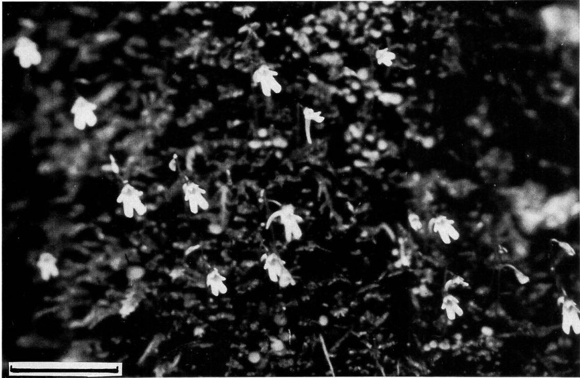
Fig. 1. — Utricularia furcellata Oliver dans son milieu; les fleurs émergent des mousses recouvrant les troncs des Abies . Echelle: 1 cm.

Deux espèces ne figurent pas dans Hara & Williams (1979) et Hara, Chater & Williams (1982):