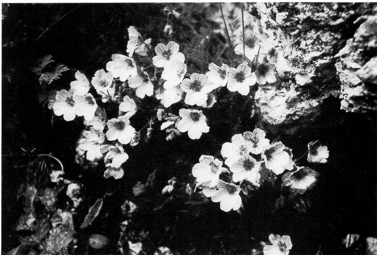
Fig. 2. — Floración de Erodium paularense.

res que definen a la subsección (caméfitos rosulados y subacaules con hojas pinnatisectas de raquis lobulado, mericarpos < 10 mm, 2n = 20 ) se cumplen en E. paularense , exceptuando el número cromosómico, que no se ha podido determinar hasta el momento debido a las dificultades encontradas al intentar cultivar la planta o conseguir la germinación de sus semillas.