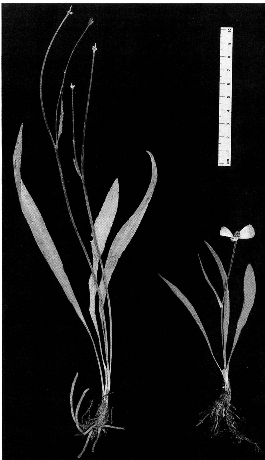
Fig. 1. — Ranunculus kuepferi subsp. orientalis von der Punta Bocca dell'Oro; links: ZT-Nr. 11201, rechts: kultiviert, ZT-Nr. 31376.