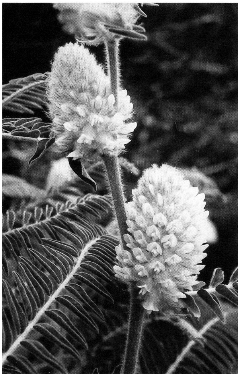
Fig. 1. — Astragalus centralpinus Br.-Bl.: Punta-Alta, 1988.