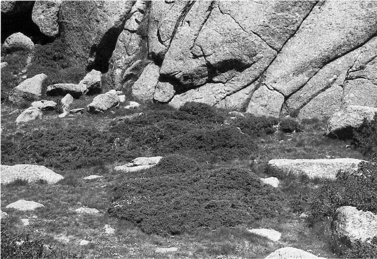
Fig. 3. — Standort von Ranunculus kuepferi an der Punta Bocca dell'Oro (Fundstelle a, Abschnitt 4): Weiderasen mit Juniperus nana (in der bildmitte), umgeben von Erlengebüsch (ganz rechts) und Silikatfelsen.

einer andern Art der R. pyrenaicus -Gruppe als zu R. kuepferi ist unwahrscheinlich. Jedoch kann nicht ausgeschlossen werden, dass es sich bei den zwei fraglichen Populationen um die diploide Unterart und nicht um die polyploide subsp. orientalis handelt.