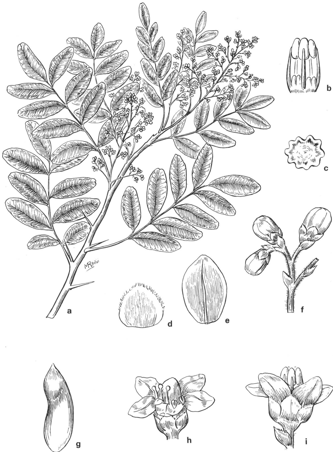
Fig. 1. — Schinopsis glabra (Engl.) F. Barkley & T. Meyer a) ramita en flor, [França s.n. "Pernambuco, Recife", X.1957 (NY)], \times 0.46 ; b) disco y estambres, \times 11.5 ; c) disco, \times 19 ; d) sépalo, \times 19 ; e) pétalo, \times 19 ; f) pimpollos, \times 7 ; g) fruto, \times 0.95 [Williams 163 "La Paz, Caupolicán, Apolo", 16.IV.1902 (NY, US)]; h) flor pistilada, \times 14.5 ; i) flor estaminada, \times 14.5 .