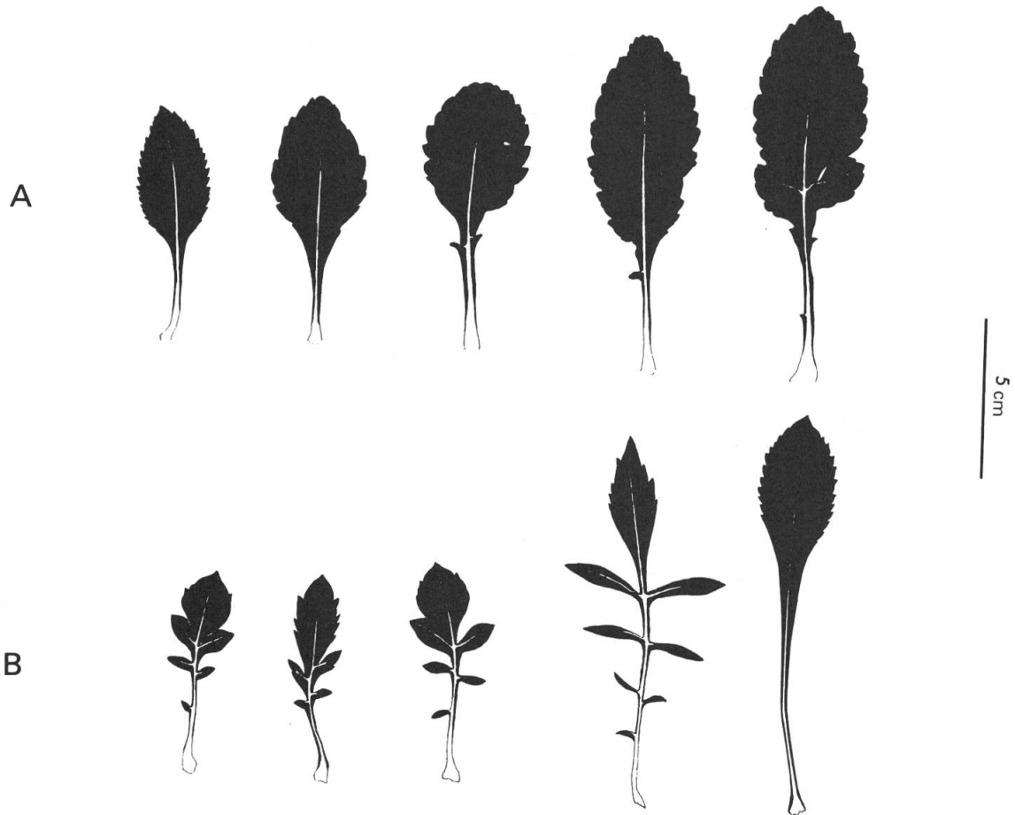
Fig. 1. — Hojas basales de (A) Cephalaria squamiflora subsp. balearica (Mallorca); (B) C. squamiflora subsp. mediterranea (Ibiza).