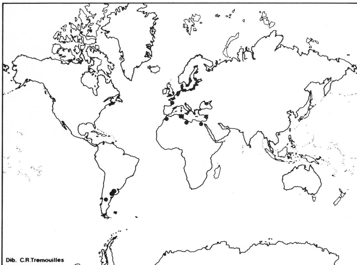
Fig. 1. — Distribución geográfica mundial de Chara baltica Bruzelius, incluyendo las localidades de Argentina.

MIGULA (1897), es habitante exclusiva de la costa y aparece en la costa misma o bien en aguas salobres en contacto directo con el mar (en relación al Mar Báltico), profundas o poco profundas, pero nunca en mares abiertos de salinidad normal ni en aguas dulces.