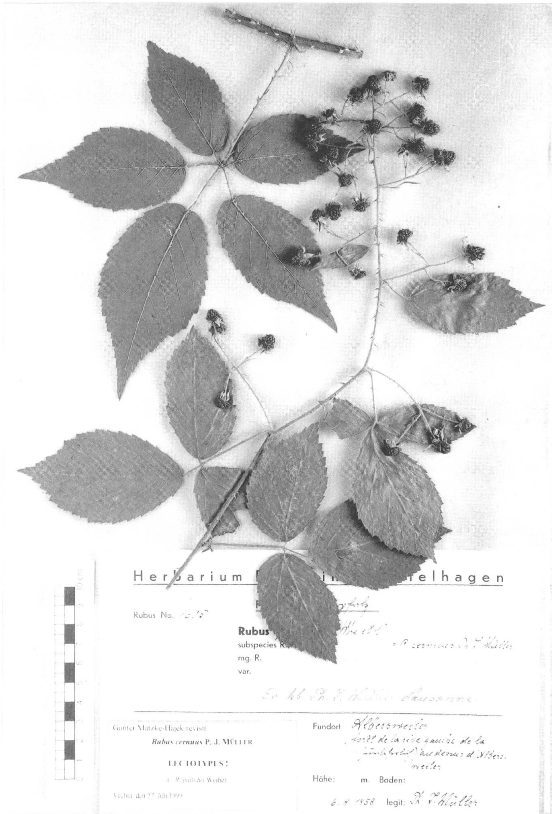
Fig. 1. – Rubus cernuus P. J. Müll. Lectotype (STR) [= R. pallidus Weihe].