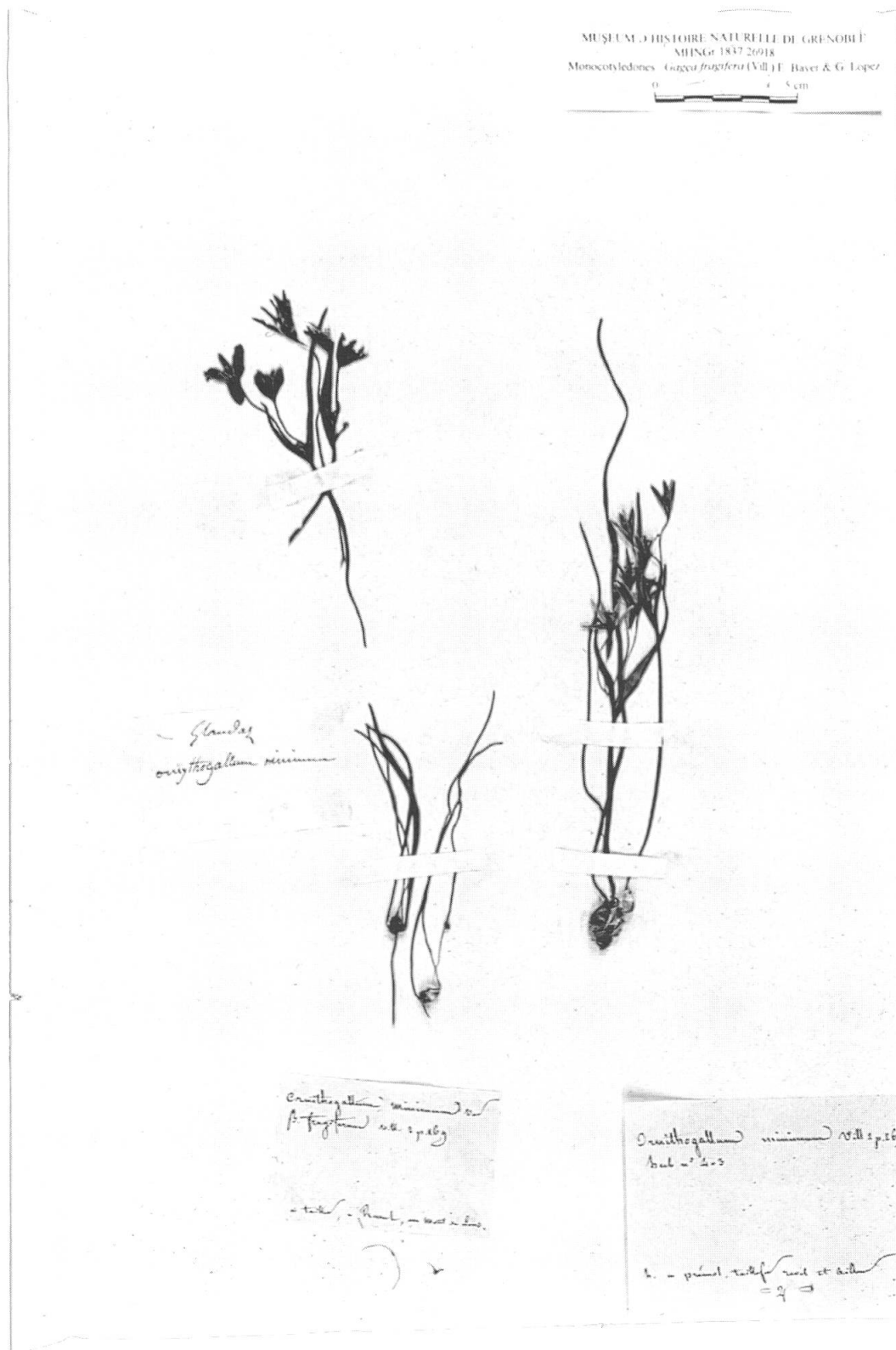
Fig. 2. – Lectotype de Ornithogalum fragiferum Vill., spécimen inférieur gauche [s. coll. s.n., GRM].