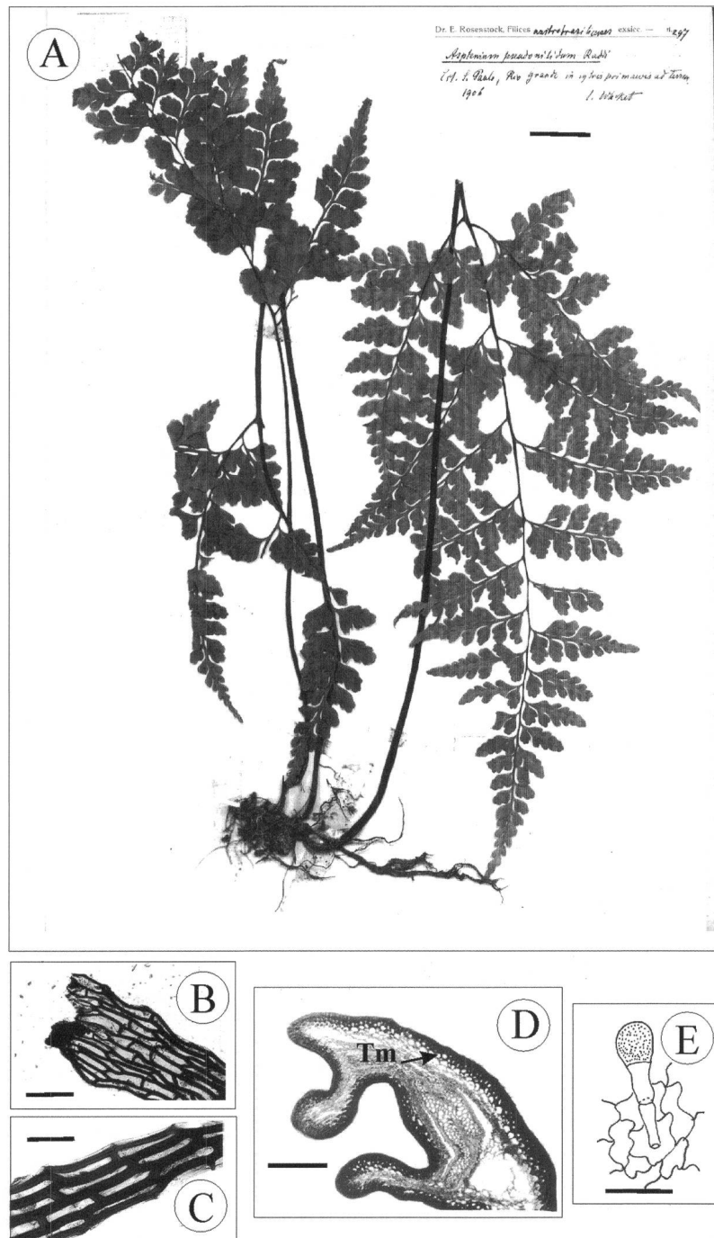
Fig. 2. – Asplenium pseudonitidum Raddi. A. Ejemplar de herbario representativo (Rosenstock 297, LP); B. Base de escama rizomática; C. Detalle de la zona media de escama rizomática donde se observa el margen entero y el engrosamiento de las paredes celulares; D. Transcorte de pecíolo surcado dorsalmente y alado, con tejido esclerenquimático subepidérmico (Tm); E. Pelo glandular del hipofilo.

[Escala: A: 2 cm, B-C: 200 µm, D: 300 µm, E: 25 µm]