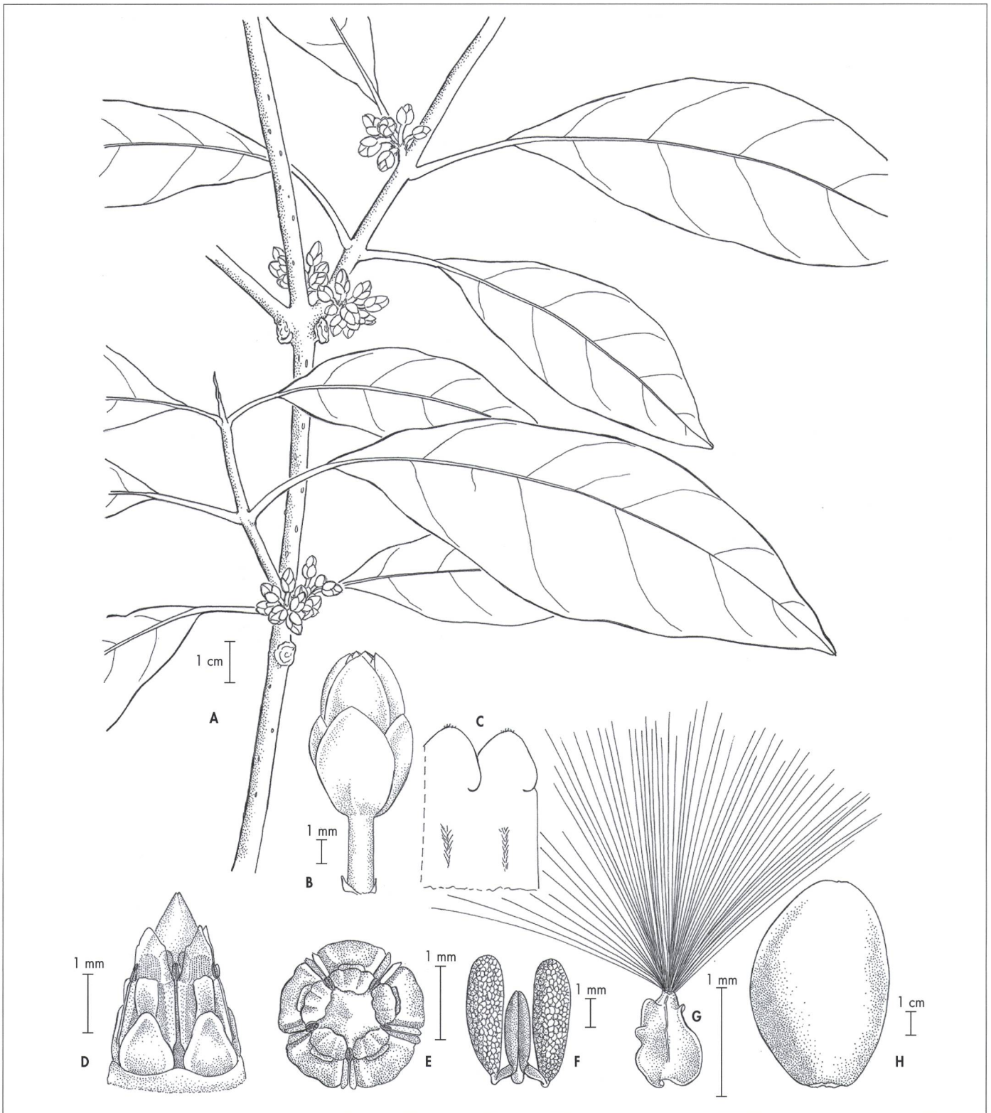
Fig. 1. – Marsdenia cuixmalensis Juárez-Jaimes & L. O. Alvarado. A. Rama con inflorescencias; B. Flor; C. Detalle del interior de la corola; D. Ginostegio; E. Vista apical del ginostegio; F. Polinario; G. Semilla; H. Fruto.

[Lot# 3651, MEXU] [Dibujo de E. Esparza]