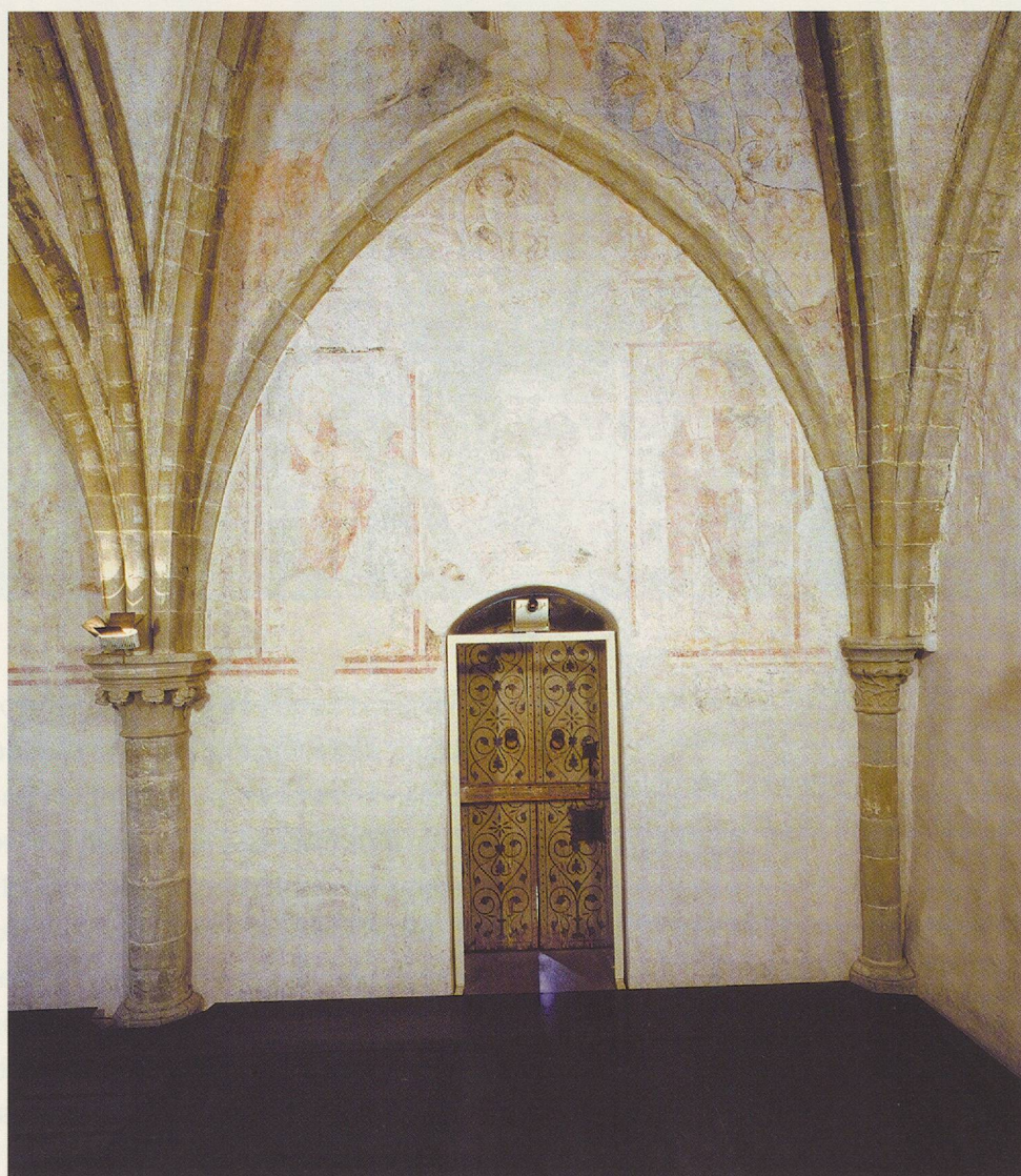
► Fig. 15 Paroi sud, travée ouest, sans projection d'image lumineuse, ce qui permet l'observation de ce qu'il reste des peintures du début du XIV e siècle.