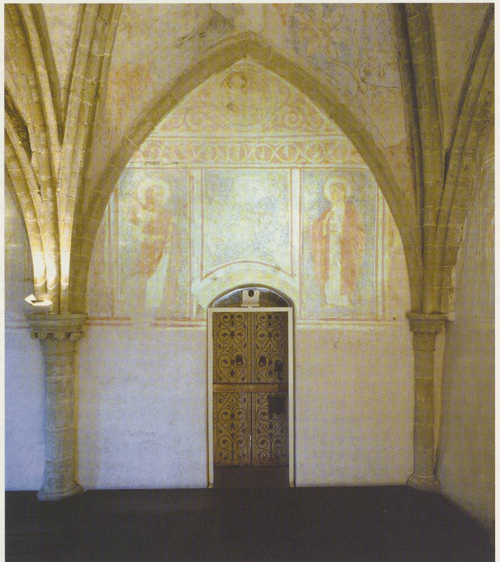
► Fig. 16 Paroi sud, travée ouest, avec projection d'image lumineuse.

Les avis recueillis au cours du colloque confirmèrent aussi bien la qualité des recherches pluridisciplinaires effectuées que la plausibilité du projet de restauration. Les études d'exécution pouvaient ainsi s'engager sur la base d'hypothèses solidement étayées. L'Association, convaincue par ces avis autorisés et séduite par l'originalité de la proposition, adopta formellement le projet le 22 mai 1995.