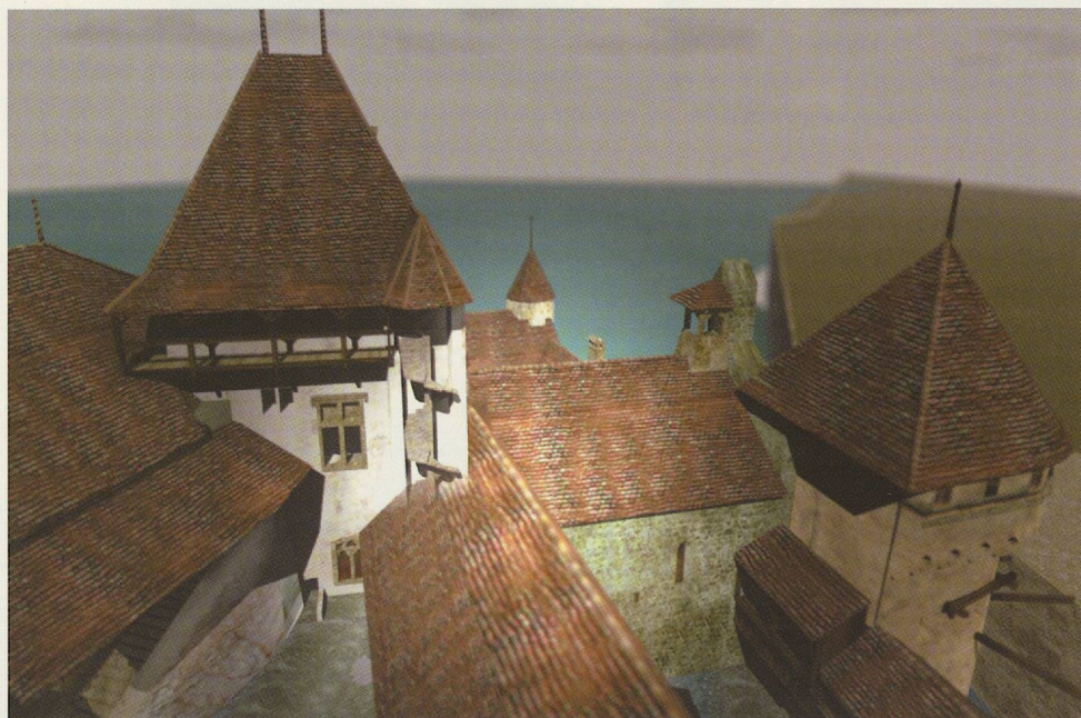
► Fig. 18 Ecorché informatique montrant l'escalier en vis établissant la liaison entre la chapelle et la camera domini et se prolongeant à la hauteur du chemin de ronde de la seconde enceinte et du couronnement de la tour X.

La chapelle représentait une première étape de cette nouvelle présentation du château. Chillon est en effet connu pour être une forteresse militaire, mais on oublie parfois que le château était aussi une résidence de la famille de Savoie, qui n'y habitait pas en permanence mais y faisait des séjours réguliers. La chapelle donnait l'occasion de montrer l'un des aspects de la vie privée de l'époque, à savoir l'intégration des pratiques religieuses dans l'existence quotidienne. En effet, la chapelle est reliée par un escalier directement à la camera domini , et fait partie de la zone «intime» du château (fig. 18). La mise en valeur de cette disposition permettrait au public de percevoir la trace d'un art de vivre propre à cette période de l'histoire, et d'insister sur la différence entre un lieu de piété privé et les lieux de cultes publics.