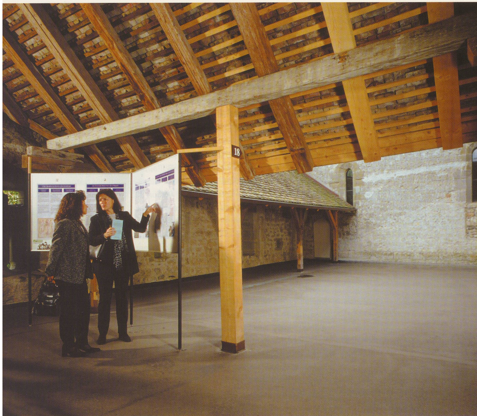
▲ Fig. 14 Panneaux explicatifs précédant la chapelle sur l'itinéraire de la visite par les chemins de ronde, ici dans la cour G.

3° les professionnels des sciences humaines (principalement les médiévistes, les historiens de l'art et de l'architecture), susceptibles de considérer le château comme un objet d'étude, et enfin les spécialistes du patrimoine, gardiens de l'orthodoxie de la conservation.