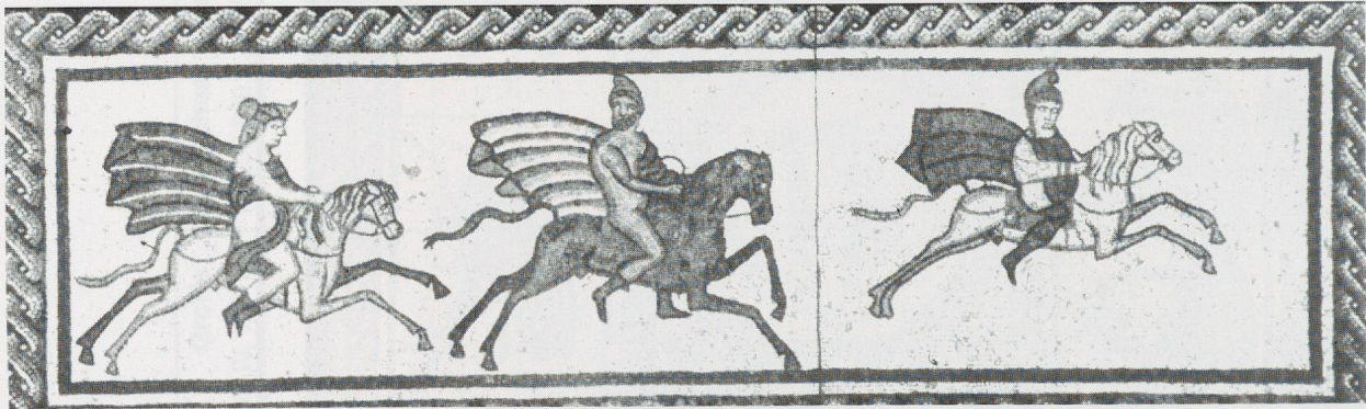
5 - Low Ham (Somerset). Détail : panneau de la chasse. Taunton, Somerset County Museum (d'après BIANCHI BANDINELLI, 1970).