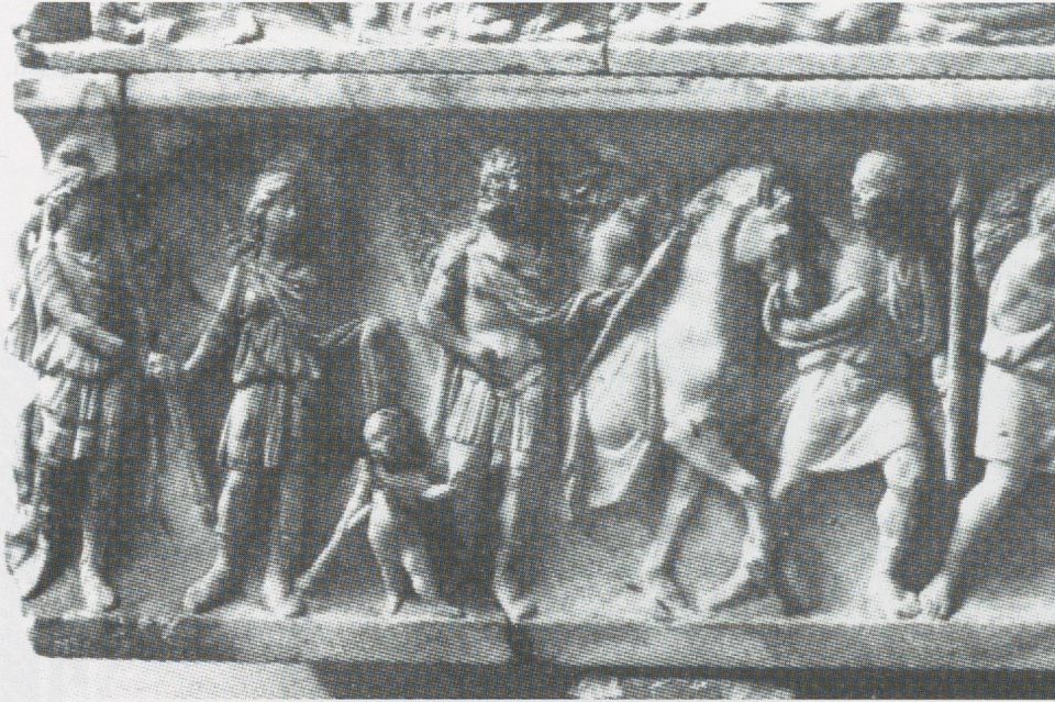
9 - Rome. Sarcophage découvert Via Cassia. Musée National Romain (d'après KOCH, SICHTERMANN, 1982).