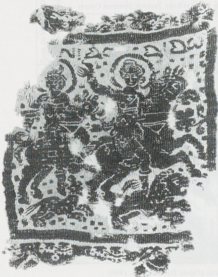
6 - Achmim (Egypte). Tissu. Düsseldorf, Kunstmuseum (Inv. 13025) (cliché du Musée).