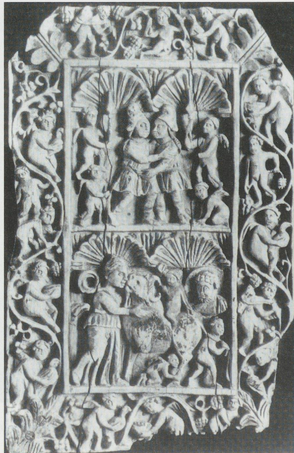
14 - Trieste. Plaque d'ivoire : Didon et Enée (?). Musée communal de Trieste (d'après VOLBACH, 1976).