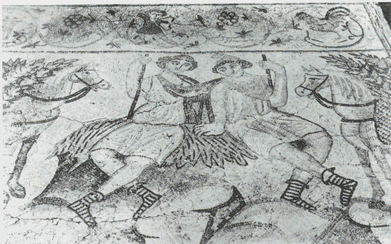
22 - Sarrín (Osrhoène). Méléagre et Atalante (d'après BALTY, 1990).