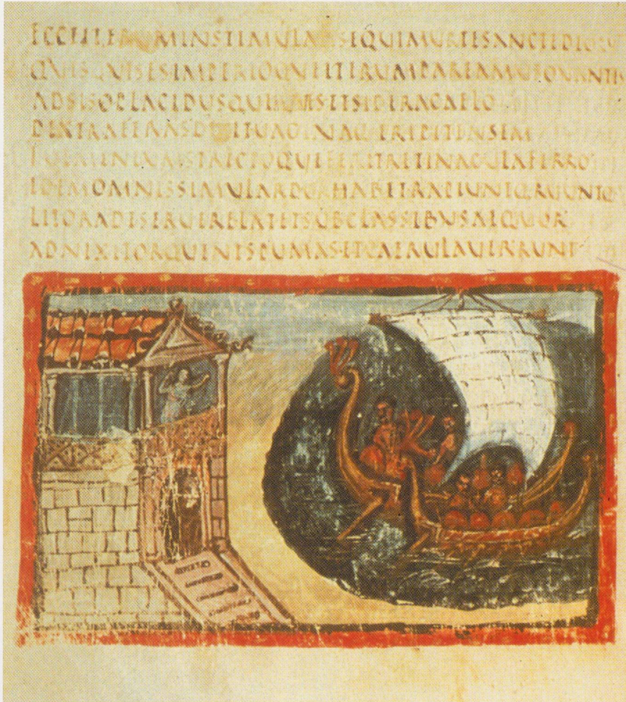
17 - Rome, Vat. lat. 3225. Abandon de Didon (fol. 39 v) (d'après WRIGHT, 1993).