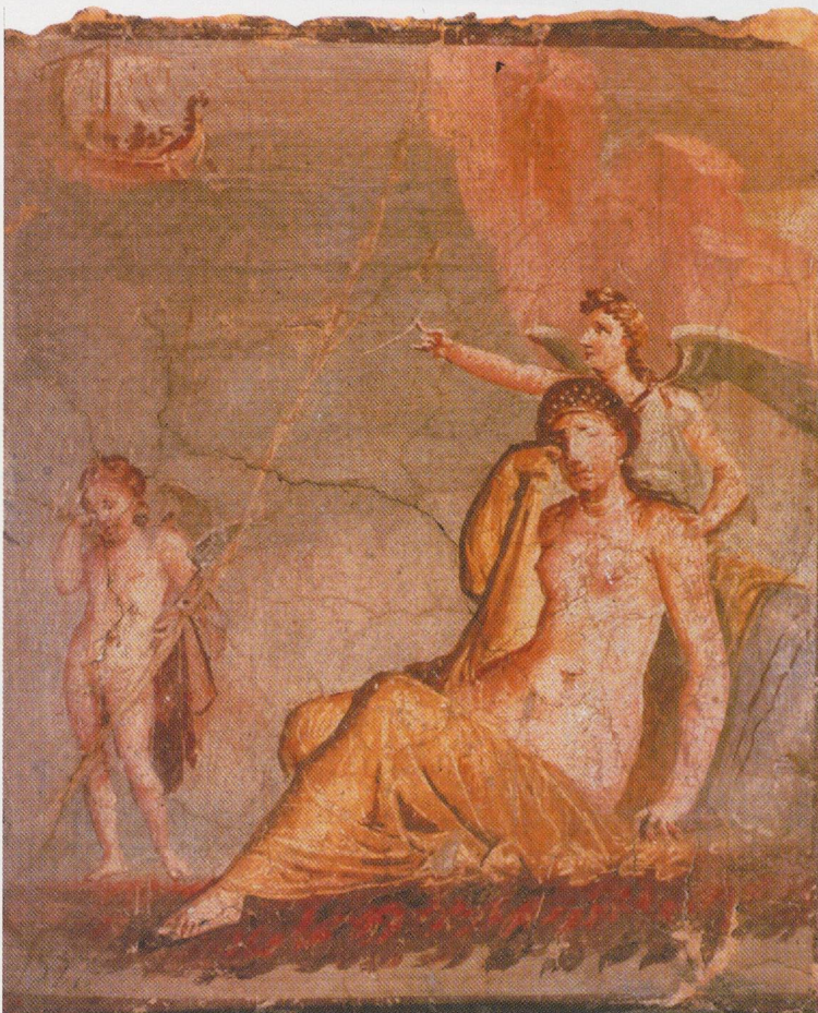
18 - Pompéi. Maison de Méléagre, VI, 9, 2. Ariane abandonnée. Musée archéolo- gique de Naples.