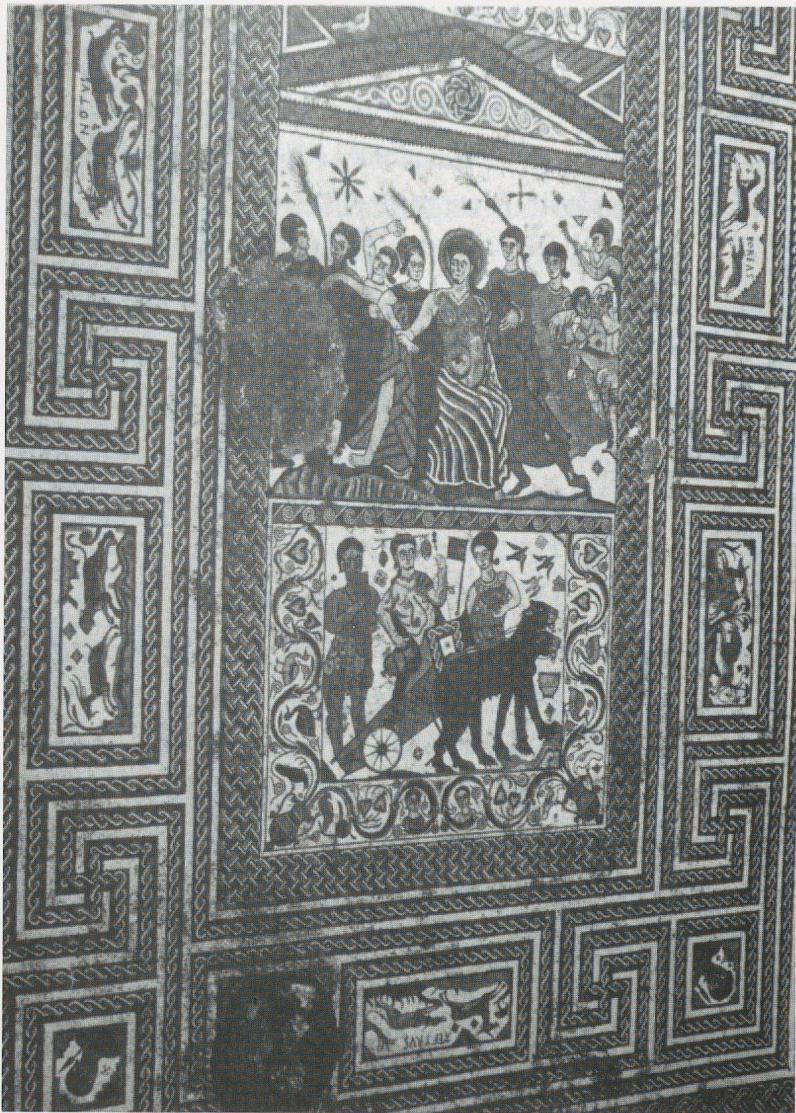
Fig. 1 Mosaico de Baños de Valdearados (Burgos). (Según J. L. Argente).