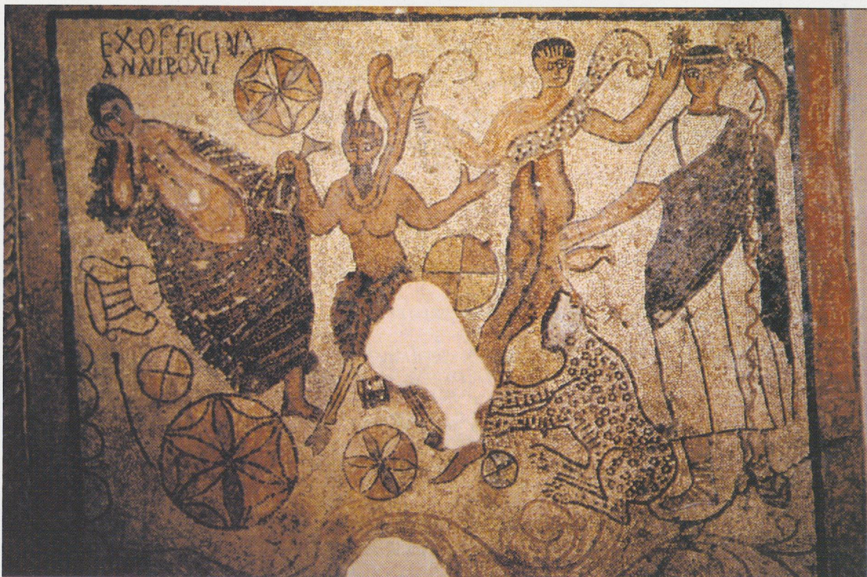
Fig. 2 Mosaico de Annus Ponius. Mérida, con el dominus unido a la escena báquica.