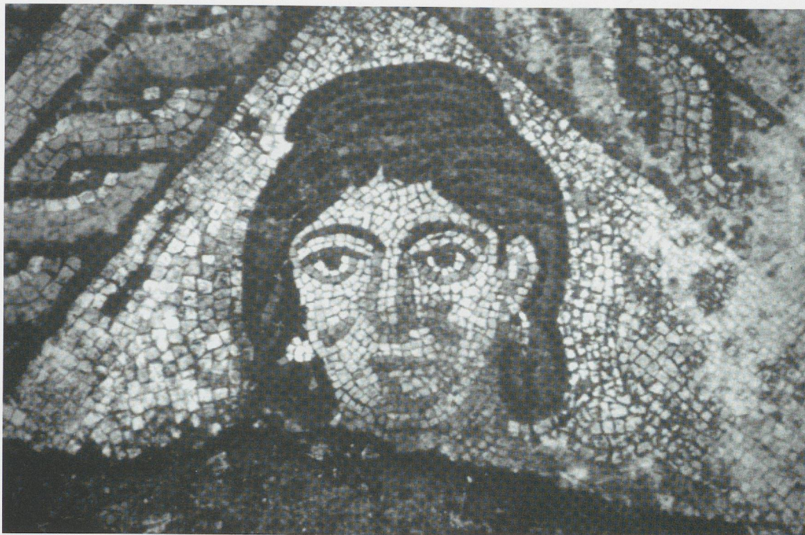
Fig. 6a - Mosaico de Olivar del Centeno. Retrato de una de las hijas. Olivar del Centeno. (Según M. C. García-Hoz).