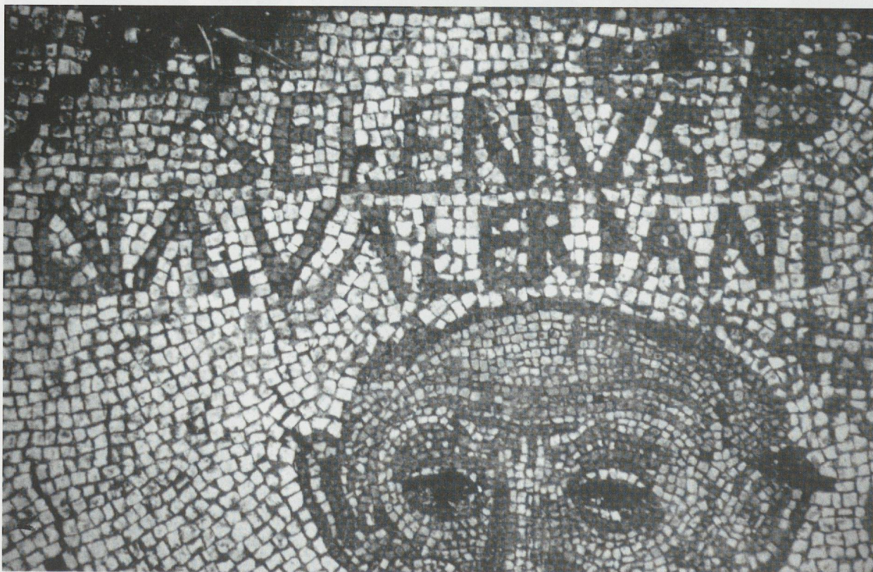
Fig.6d - Retrato del dominus representado como Sileno. Olivar del Centeno.