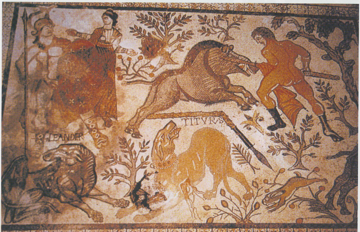
Fig. 4 Mosaico de Carranque (Toledo), con la caza del jabalí de Calidón por Adonis.