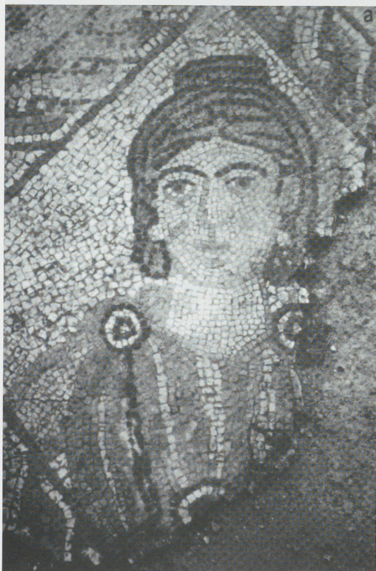
Fig.6b - Mosaico con el retrato de una de las hijas. Olivar del Centeno.