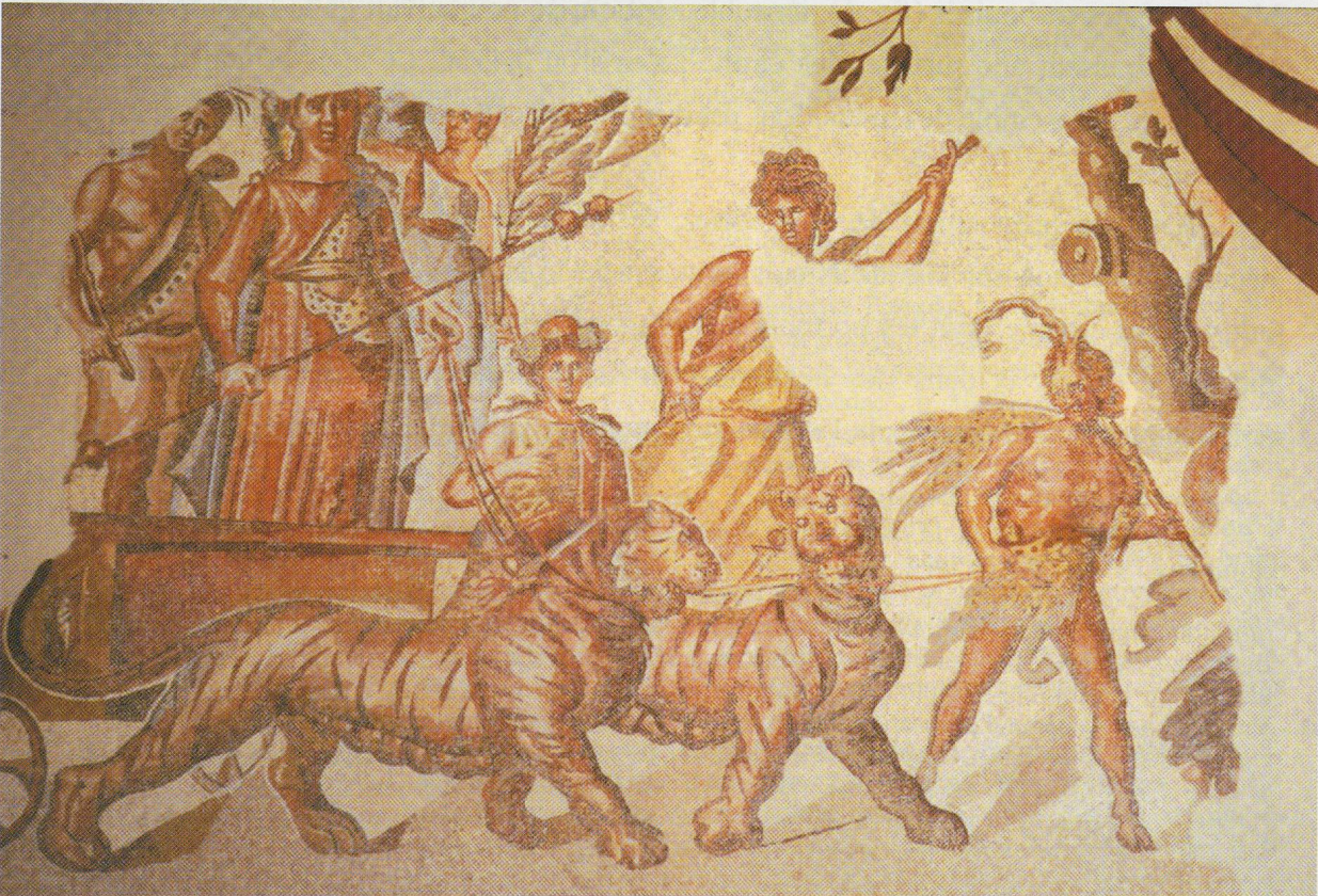
Fig. 7 Mosaico con pompa triumphalis de Zaragoza.

saque mesure 2,47 m de diamètre, et fond blanc à fleurettes centrales et appui deux rinceaux. se sur des rochers. Derrière elle se découvre l'arc d'entrée en Placé-Jos Les la découverte de la mosaïque est illustrée par S. Kozlov. Placé en discussion avec Christian Adelin, couvrent l'étude iconographique de ces circonstances de la décoration. Les mosaïques, notamment de celle et illustré par S. Kozlov. Placé en discussion avec Christian Adelin, couvrent l'étude iconographique de ces circonstances de la décoration. Les mosaïques, notamment de celle et illustré par S. Kozlov. Placé en discussion avec Christian Adelin, couvrent l'étude iconographique de ces circonstances de la décoration.