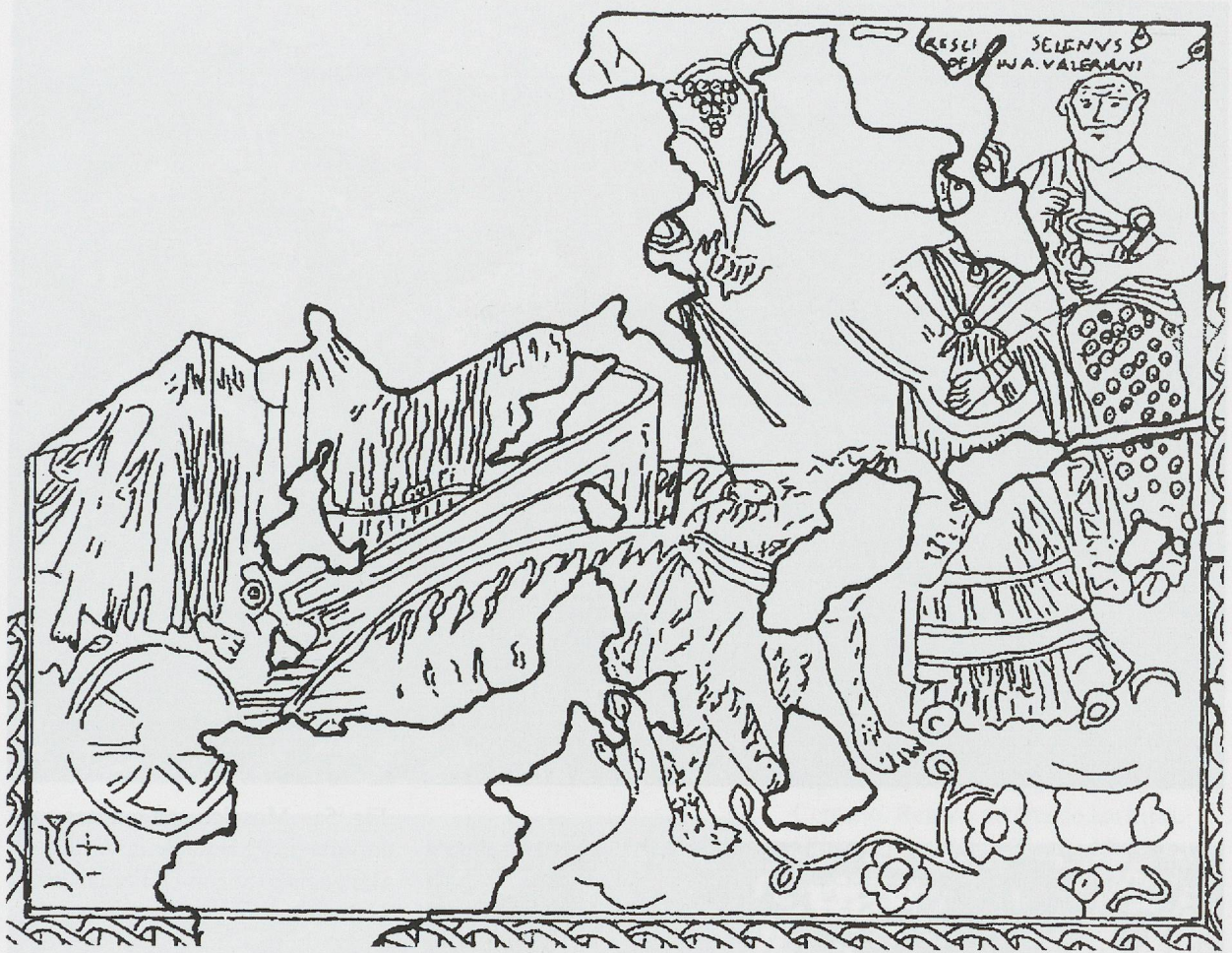
Fig. 3 Mosaico báquico del Olivar del Centeno (Cáceres), con el matrimonio unido a la pompa triumphalis como Sileno y Menade. (Según M. C. García-Hoz).