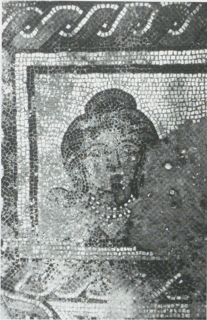
Fig.6e - Retrato de Dama. Baños de Valdearados.

saque mesure 2,47 m de diamètre, et fond blanc à fleurettes centrales et appui deux rinceaux. se sur des rochers. Derrière elle se découvre l'arc d'entrée en Placé-Jos Les la découverte de la mosaïque est illustrée par S. Kozlov. Placé en discussion avec Christian Adelin, couvrent l'étude iconographique de ces circonstances de la décoration. Les mosaïques, notamment de celle et illustré par S. Kozlov. Placé en discussion avec Christian Adelin, couvrent l'étude iconographique de ces circonstances de la décoration. Les mosaïques, notamment de celle et illustré par S. Kozlov. Placé en discussion avec Christian Adelin, couvrent l'étude iconographique de ces circonstances de la décoration.