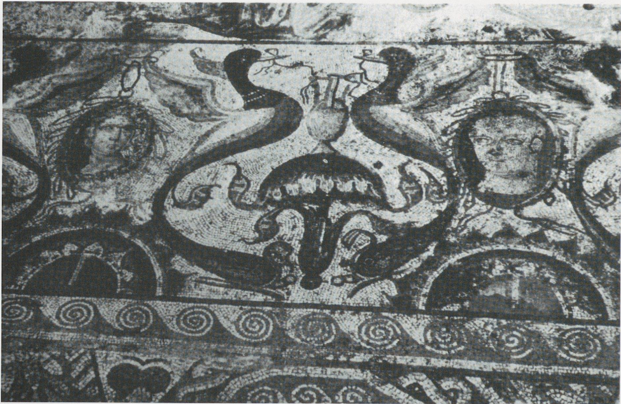
Fig. 5a - Mosaico con retratos en la Villa de Pedrosa de la Vega (Palencia). (Según D. Fernández-Galiano).