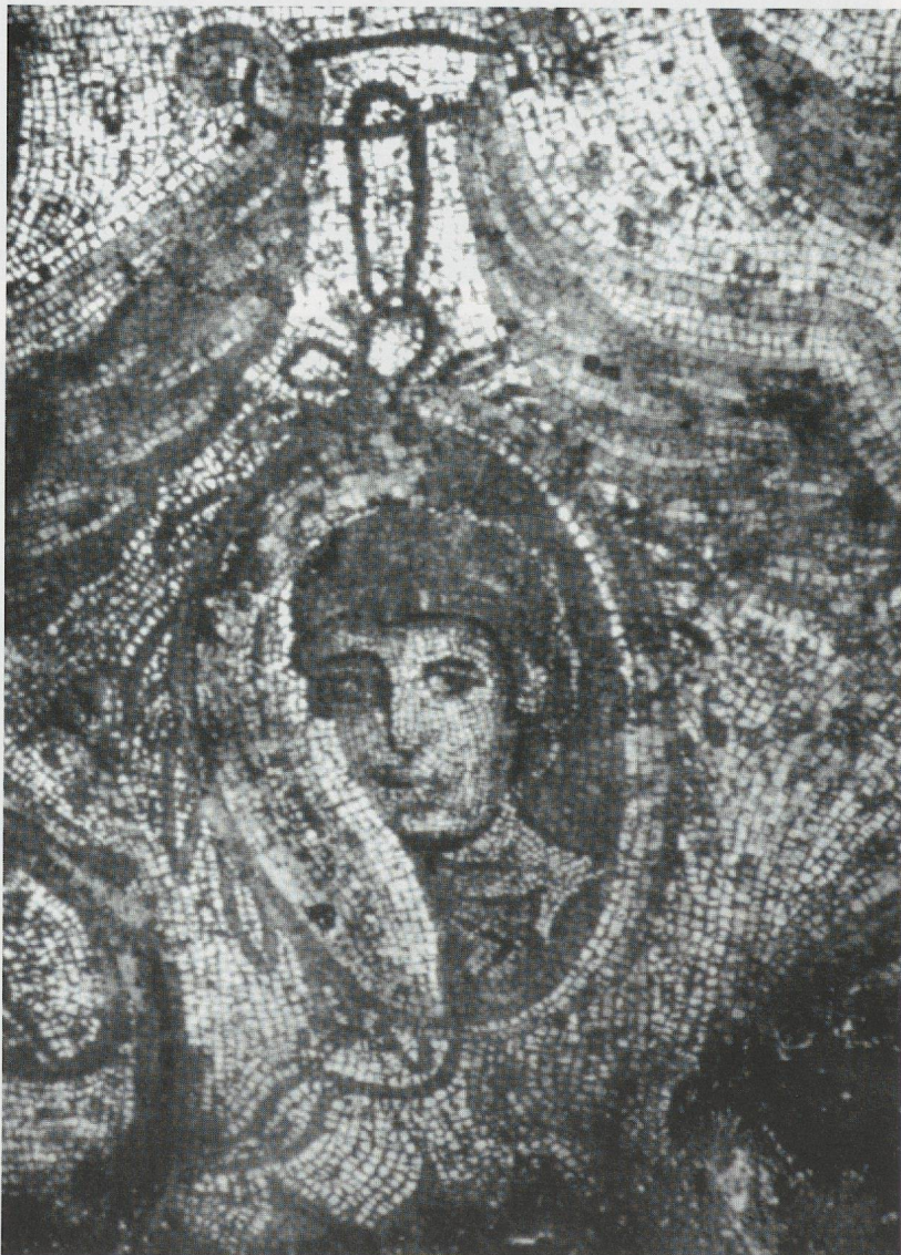
Fig. 5b - Mosaico con retrato en la Villa de Pedrosa de la Vega (Palencia).