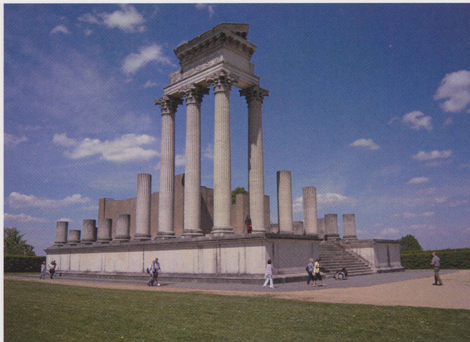
Fig. 4 — Xanten, parc archéologique, le temple du port.

relativement peu étendue, sont en effet visibles sous une dalle de verre; mais un élément essentiel de cette véritable scénographie est le mur de fond du pavillon, sur lequel apparaissent les passages du texte de César relatifs au territoire qui deviendra celui d' Octodurus et aux peuples qui l'habitaient.