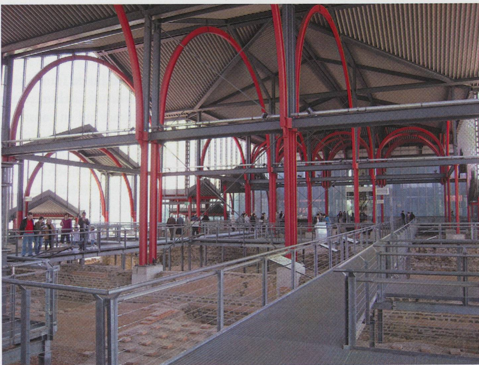
Fig. 3 — Xanten, parc archéologique : les grands thermes et la couverture moderne.

l'objet d'une évocation particulièrement riche, à la fois scientifique et pédagogique, lorsqu'elle s'appuie sur une étude archéologique de haut niveau, qu'elle met en œuvre les compétences indispensables et que la volonté est présente. À Martigny encore, lors du colloque, la visite sous la conduite de M. Léonard Gianadda lui-même du pavillon qui s'élève désormais à proximité de la Fondation et qui allait être inauguré quelques jours plus tard a donné l'occasion de voir un spectaculaire exemple de l'intégration des vestiges archéologiques dans le paysage urbain par l'intermédiaire d'une réalisation architecturale contemporaine avec pour objectif une évocation intellectuelle du passé de la cité. Les résultats de la fouille, sur une surface