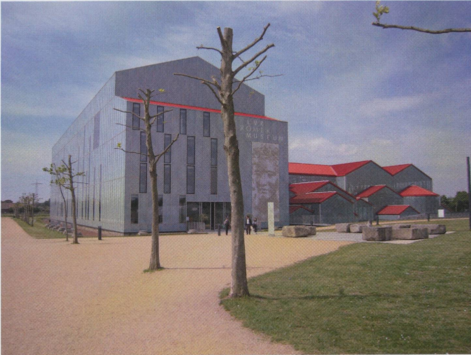
Fig. 2 — Xanten, parc archéologique : le nouveau musée et le bâtiment abritant les thermes (cl. F. Baratte).