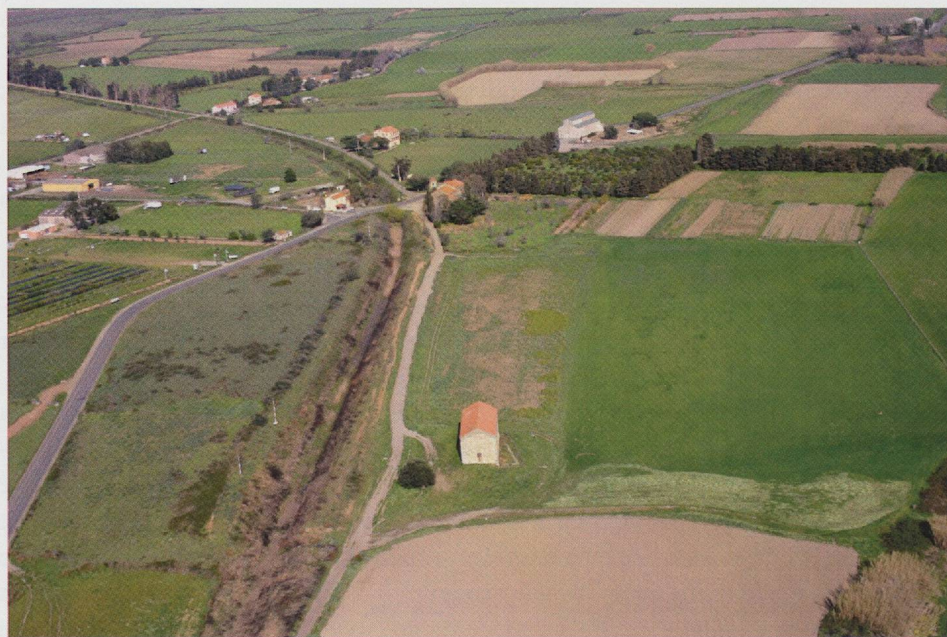
Fig. 1 — Vue aérienne du site archéologique. Au premier plan, l'église romane de San Parteo. Au second plan, la Canonica et le site archéologique de Mariana sur son flanc sud.

Vers le III e s., l'agglomération s'étend sur plus d'une vingtaine d'hectares; il n'est pas certain qu'elle ait été défendue par un rempart. Elle est organisée selon un plan orthonormé au centre duquel semble se trouver le forum (fig. 2). Deux vastes nécropoles ont pris place à l'est (nécropole d'I Ponti) et à l'ouest (nécropole de Palazzetto-Murotondo) de l'espace urbain. Plusieurs axes routiers sont connus dont l'un, le plus méridional et bordé de portiques, se prolonge vers l'intérieur des terres et vers le littoral où pourrait se trouver au moins l'un des ports. Dans la campagne environnante, soit dans un rayon de 5 km, plus d'une centaine d'établissements ruraux ( villae , fermes, annexes agricoles, nécropoles...) ont été repérés et dans quelques cas fouillés.