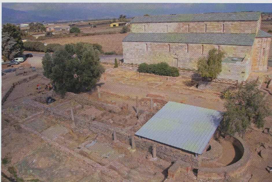
Fig. 3 — Les cathédrales de Mariana. Au premier plan, l'église paléochrétienne.

Alors que quelques quartiers semblent être déjà abandonnés, et certains depuis le III e s., un groupe épiscopal est érigé sur une domus au sud de la ville dans le courant du V e ou du VI e s. Au même moment, ou peu après, une église cimétériale (San Parteo) est bâtie au sud-ouest de la ville, au cœur d'une nécropole plus ancienne. Constitué d'une église, d'un baptistère et de plusieurs annexes, le groupe épiscopal est modifié à plusieurs reprises notamment à partir du début du VIII e s. quand Mariana est élevée au rang d'unique siège épiscopal de l'île. Ce nouveau statut permet de pérenniser l'habitat autour de la cathédrale et de conserver un véritable dynamisme durant tout le premier Moyen Âge.