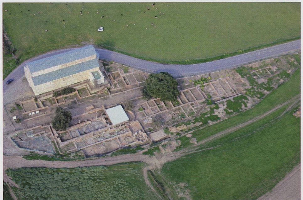
Fig. 4 — Vue aérienne de la cathédrale romane et du secteur de la ville romaine fouillé entre 1958 et 1967 puis entre 2000 et 2007.

Mariana présente une situation exceptionnelle, celle d'une ville occupée durant près de 1 500 ans, n'ayant pas fait l'objet de reconstructions destructrices. Ainsi, on peut estimer que l'espace archéologique préservé, potentiellement étudiable et valorisable, couvre une surface de plus de 50 hectares comprenant la ville, ses nécropoles et ses abords. Quant aux fouilles archéologiques, elles ont porté sur une étendue d'un peu plus de 2 500 m 2 , auxquelles il faut ajouter une zone suburbaine de plus de 2 hectares, objet de fouilles préventives.