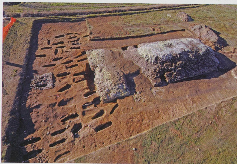
Fig. 3 — Panoramica dell'area sacra con il podio del cosiddetto Capitolium e il cimitero medievale in corso di scavo.

Anche l'anfiteatro, già noto dalle indagini ottocentesche, è stato oggetto di un nuovo intervento che ne ha riportato alla luce il settore occidentale, ora mantenuto a vista, mentre il resto del monumento e l'arena, tuttora in proprietà privata,