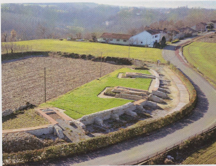
Fig. 4 — Panoramica dell'anfiteatro.