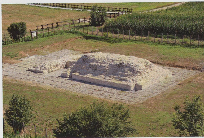
Fig. 5 — Panoramica dell'area archeologica con il podio del tempio a conclusione degli interventi.

rimangono ancora da esplorare (fig. 4). Il risultato delle indagini, condotte tra il 2001 e il 2003, ha confermato la costruzione dell'edificio su un terrapieno artificiale. La cavea, di forma ellittica (m 105,60 x 77), è risultata delimitata da un muro perimetrale cui si addossavano all'esterno una serie di contrafforti posti a distanza regolare che sostenevano un prospetto ad archi. Avancorpi ad U erano destinati agli scalini in laterizi, ancora conservati, per accedere alle gradinate dell'ordine superiore, presumibilmente in legno, mentre un corridoio in parte voltato, conduceva a quelle inferiori. I pochi materiali rinvenuti nello scavo, soprattutto monete in bronzo (assi di Antonino Pio, Faustina II e un sesterzio di Adriano), indicano l'utilizzo del monumento, costruito dopo la metà del I d.C., per tutto il II secolo.