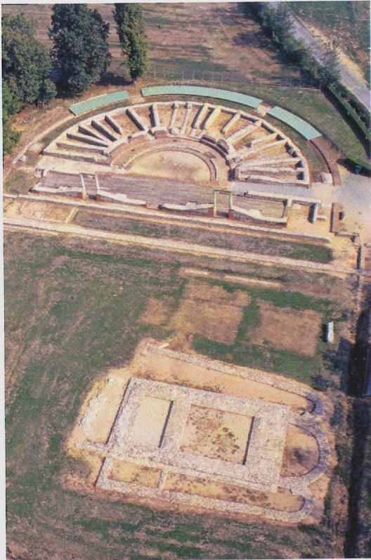
Fig. 2 — Panoramica dell'area archeologica con il teatro e il complesso della porticus post scaenam.

affittando, anche a spese proprie, i terreni dai contadini e reinterrendo poi gli edifici messi in luce. Essi individuarono l'impianto urbano di tipo regolare con strade ortogonali tra loro (cardini e decumani) e il perimetro della città, che aveva una superficie di poco più di ventun ettari ed era delimitata da un fossato ( vallum ) e da un terrapieno ( agger ) con palificata lignea, torri angolari in muratura e porte urbane monumentali in corrispondenza dei due accessi. Indagarono anche alcuni dei principali edifici pubblici (teatro, foro, terme e anfiteatro). Dopo una lunga interruzione, negli anni cinquanta del Novecento, la Soprintendenza archeologica riprese le indagini sul sito, esplorando l'area sacra del Foro dove si ergono i resti del podio del cosiddetto tempio principale della città, interpretato anche come un Capitolium , e il complesso del teatro e del retrostante porticato ( porticus post scaenam ), poi espropriato e trasformato in un'area archeologica demaniale di limitate dimensioni (fig. 2).