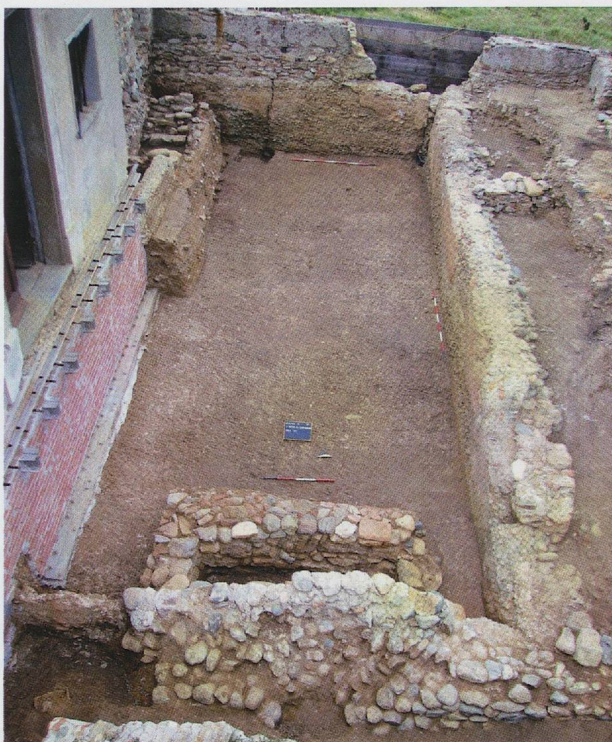
Fig. 3 — Quiliano. San Pietro in Carpi gnano. La vasca romana.

ispezione nell'area sotterranea 6 . Le placche metalliche mobili per esigenze legate alla conservazione e alla sicurezza sono state recentemente sostituite da lastre fisse in vetro.