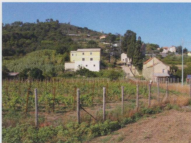
Fig. 6 — Quiliano. I casali e sul fondo la chiesa.

Maggiore criticità presenta al momento l'allestimento di un'adeguata esposizione dei reperti rinvenuti nel sito, di grande rilevanza nel panorama archeologico savonese e ligure. Un progetto espositivo dei reperti nell'ambito di spazi individuati nella sede del Comune, che potrà completare la visita all'area archeologico-naturalistica,