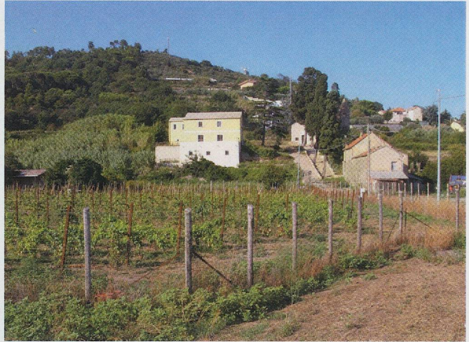
Fig. 6 — Quiliano. I casali e sul fondo la chiesa.

Maggiore criticità presenta al momento l'allestimento di un'adeguata esposizione dei reperti rinvenuti nel sito, di grande rilevanza nel panorama archeologico savonese e ligure. Un progetto espositivo dei reperti nell'ambito di spazi individuati nella sede del Comune, che potrà completare la visita all'area archeologico-naturalistica,