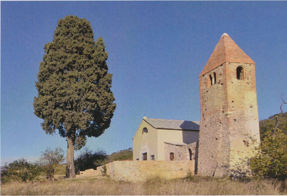
Fig. 4 — Quiliano. Chiesa di S. Pietro in Carpignano. La vasca romana.

e poi l'insediamento altomedievale e l'edificio di culto abbiano sempre rappresentato un polo emergente di riferimento sul territorio (fig. 4). Ne sono indizio, ad esempio, le sepolture medievali che recavano segni del pellegrinaggio romeo e compostellano 17 , testimonianza di un'offerta di ospitalità, anche dopo la morte, da parte di una comunità religiosa sorta presso la grande arteria stradale di origine romana, attiva per tutto il Medioevo e sino all'età moderna per comunicazioni e scambi commerciali con l'area padana e l'Europa 18 . E' proprio la buona connessione con la rete viaria il denominatore comune che ha reso zona dinamica e referenziale il sito di Carpignano nelle successive fasi di occupazione e trasformazione.