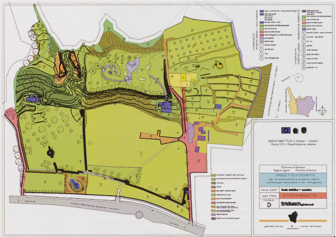
Fig. 5 — Quiliano. Tavola di progetto del Parco archeologico-naturalistico (comune di Quiliano).

tutela della Pubblica Amministrazione, ha reso possibile la progressiva valorizzazione di quest'area che unisce valori archeologici, storici e naturalistici e in cui si riconoscono elevate possibilità di sviluppo sociale e culturale.