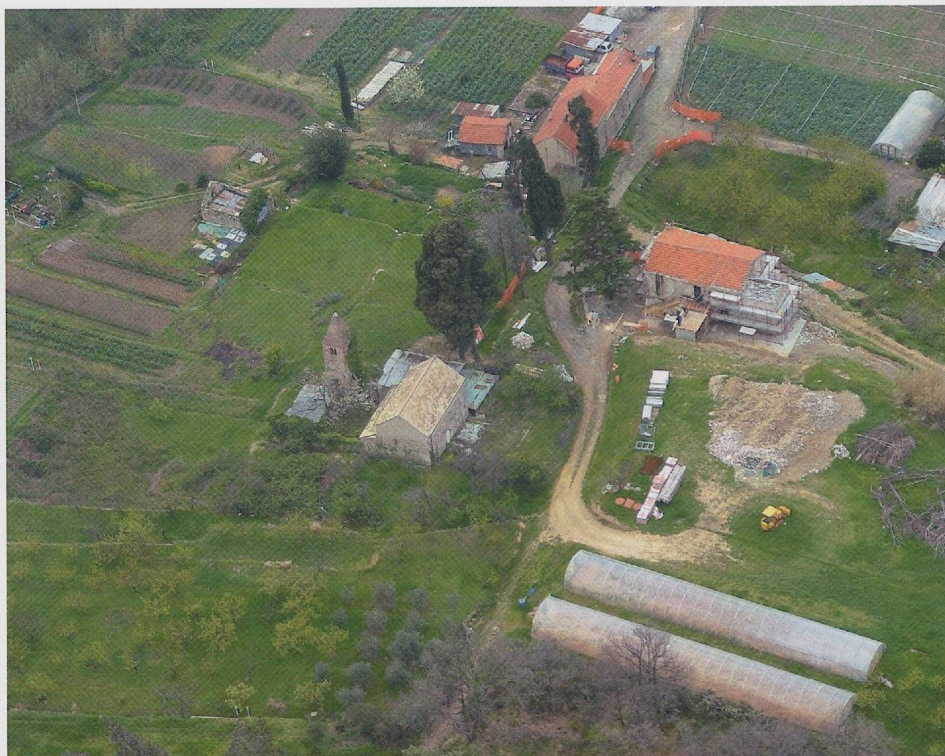
Fig. 7 — Quiliano. Area archeologica di San Pietro in Carpignano.

è in corso di studio tra Amministrazione civica di Quiliano e Soprintendenza per i Beni Archeologici.