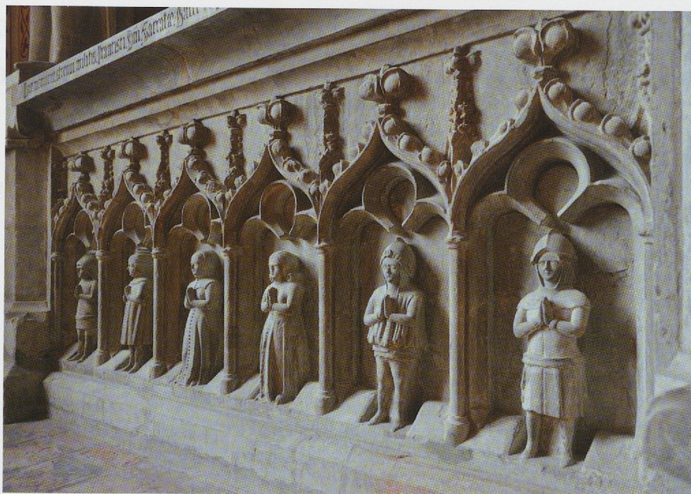
Fig. 5. La Sarraz, chapelle Saint-Antoine, monument de François I er de La Sarraz, détail des priants du sarcophage.

européennes qui le situe très nettement au-dessus du reste de l'élite aristocratique vaudoise. Des préoccupations familiales ne sont cependant pas entièrement étrangères à ce choix, puisque le célèbre chevalier rejoignait en fait dans le chœur de la cathédrale ses cousins Guillaume († 1301) et Othon († 1312) de Champvent ainsi que son neveu Pierre d'Oron († 1323) qui, tous trois évêques de Lausanne, y avaient établi le lieu de leur dernier sommeil 63 . Si les sources explicites sont rares et les identifications avec les monuments funéraires subsistants difficiles, l'inhumation d'un évêque dans sa cathédrale est traditionnelle et donc très vraisemblable à Lausanne aussi, où deux gisants épiscopaux datables des années 1300 peuvent ainsi être attribués aux cousins d'Othon I er de Grandson 64 .