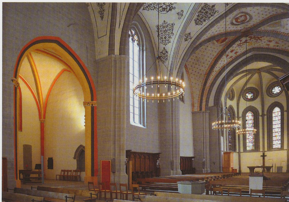
Fig. 2. Lausanne, église Saint-François, chapelle de Billens (sur la gauche).

qu'il la détenait « pacifiquement depuis son grand-père et son arrière-grand-père », sans pour autant nommer ces derniers 5 . Au cours du XIII e siècle, on commence cependant à trouver des allusions à des sépultures de nobles dans des monastères, comme celles de certains Grandson à Romainmôtier, mais sans aucune précision sur l'aspect des tombes ou même leur emplacement 6 .