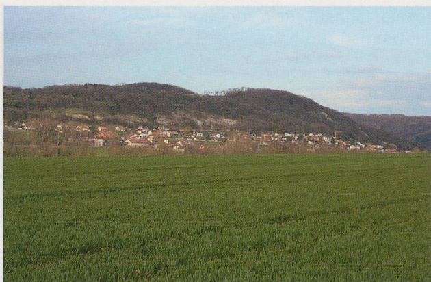
Fig. 342 La colline du Mormont vue de la vallée de la Venoge, au sud.

drainé par le Nozon, ouverte sur le lac de Neuchâtel au nord (vers le Rhin) et la vallée de la Venoge, qui se jette dans le Léman, au sud (vers le Rhône). L'absence de toutes traces de fortification et de mobilier dans les zones labourées en contrebas des terrasses où sont installées les fosses ne permet pas de conclure à l'existence d'un oppidum, mais aucune prospection systématique n'a encore été réalisée à ce jour.