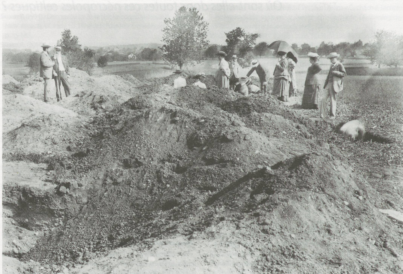
Fig. 1. Visite sur la fouille du cimetière de Münsingen-Rain en juillet 1906.

partie de la société celtique. Les morts ensevelis en nécropoles ou en tombes isolées, ont certainement été choisis sur la base d'un statut particulier, défini par leur société selon des critères que nous ne comprenons qu'incomplètement aujourd'hui. Il est fort probable que l'aristocratie soit fortement représentée parmi ceux jouissant du privilège d'une sépulture.