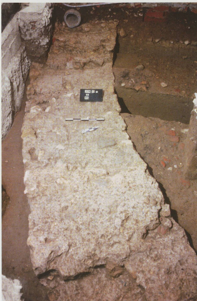
Fig. 61. Temple rond. Les maçonneries relevées dans la cave de l'immeuble sis 14, avenue Jomini. Vue du sud.