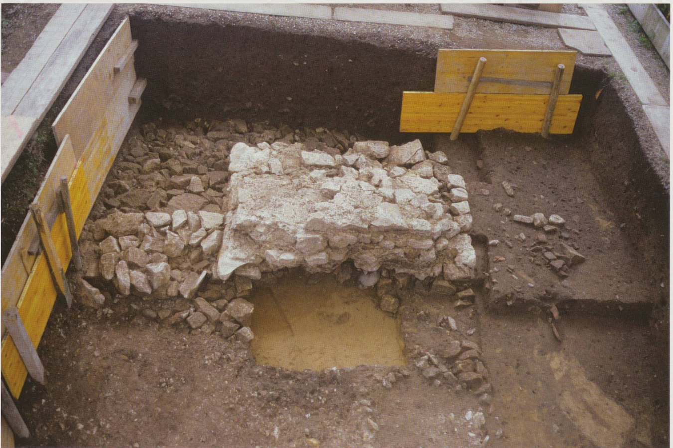
Fig. 64. Temple rond. Les substructions de l'escalier. Vue du nord.

Ces différentes campagnes de fouille ont touché également le mur de péribole sud de la cour du temple, sa cour et les murs qui l'ont séparée de celle du temple carré de la Grange des Dîmes à l'un ou l'autre de leurs états. Ces vestiges seront décrits plus loin, pour autant qu'ils ressortissent à l'état du sanctuaire tel que nous le restituons vers le milieu du II e siècle 264 . On retiendra d'ores et déjà que le temple rond s'affirme, peu avant son homologue carré de Derrière-la-Tour, comme le premier édifice sacré circulaire à colonnade, bâti en dur, dans ce secteur du pied oriental de la colline d'Avenches.