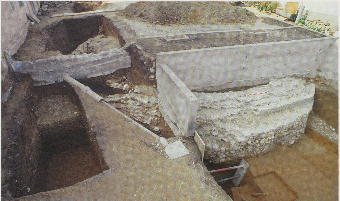
Fig. 60. Temple rond. Les vestiges dégagés par les sondages de 1992. Vue du sud-ouest.