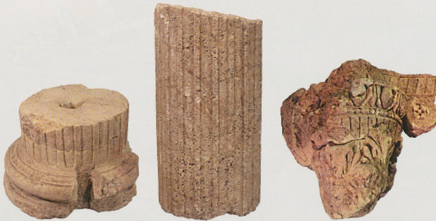
Fig. 63. Temple rond. Vestiges de la colonnade de l'ambitus.