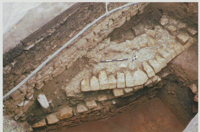
Fig. 62. Temple rond. L'un des angles du podium de l'ambitus. Vue du nord-est.