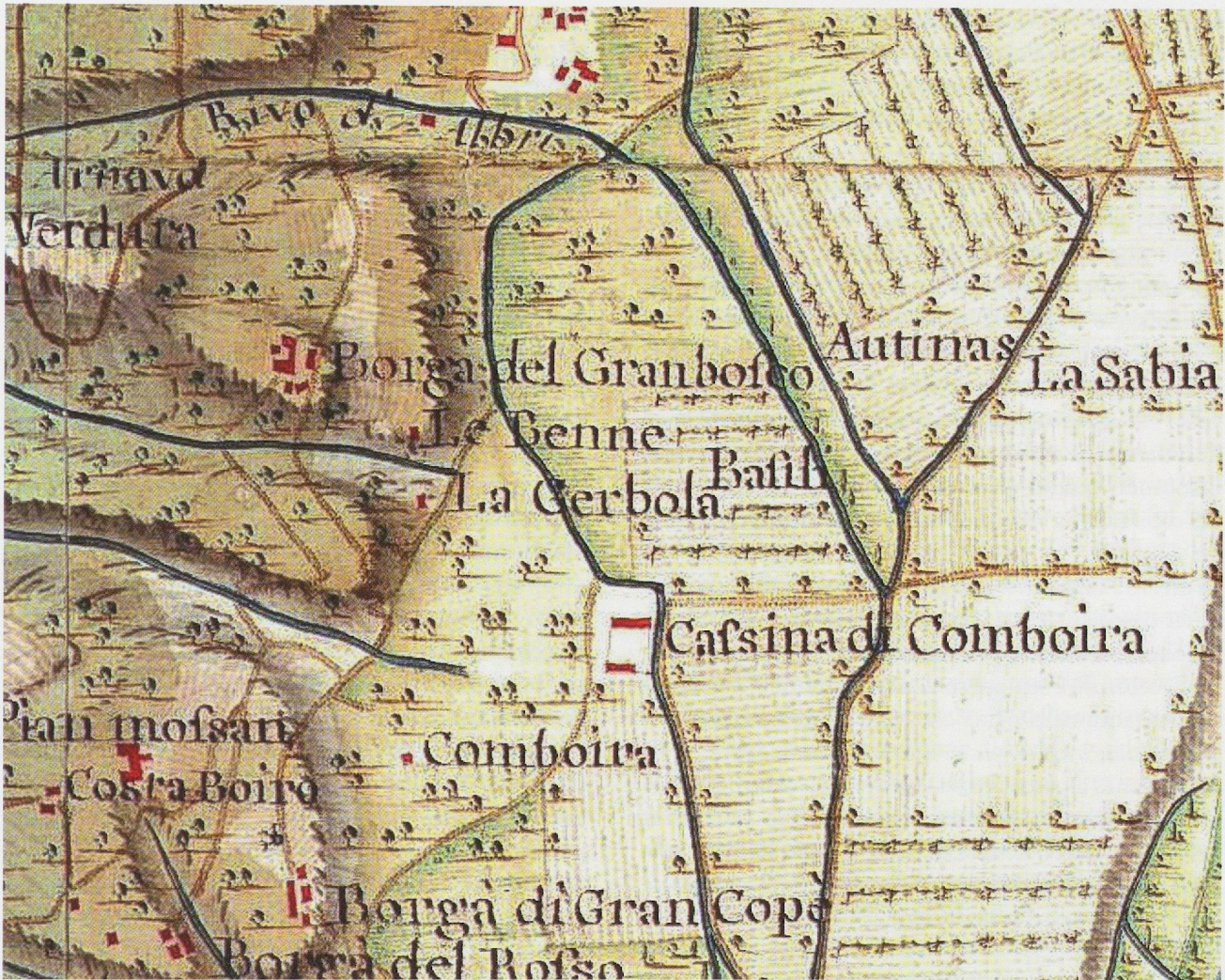
Fig. 6 - Il territorio di Comboira, la seconda grangia (Carta 1764-1772, Parte Settima).