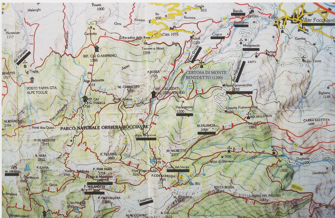
Fig. 3 - I "termini" di Monte Benedetto in territorio di Villar Focchiardo, con alcuni dei toponimi più frequentemente citati (Cartina del Parco naturale Orsiera-Rocciavré).

Salbasino" ha origine sopra il torrente Chiaretto e poco sotto la strada che dal villaggio conduce alla Certosa, e che nei suoi pressi, su un poggio ("molario seu truch"), gli arbitri hanno fatto piantare un termine che dista 52 trabucchi (circa 160 metri) dalla chiesa della correria antica (situata "pochi passi" 25 più in basso di quella che era ormai un'ex-Certosa, poiché nel 1498 la sede era stata trasferita a Banda).