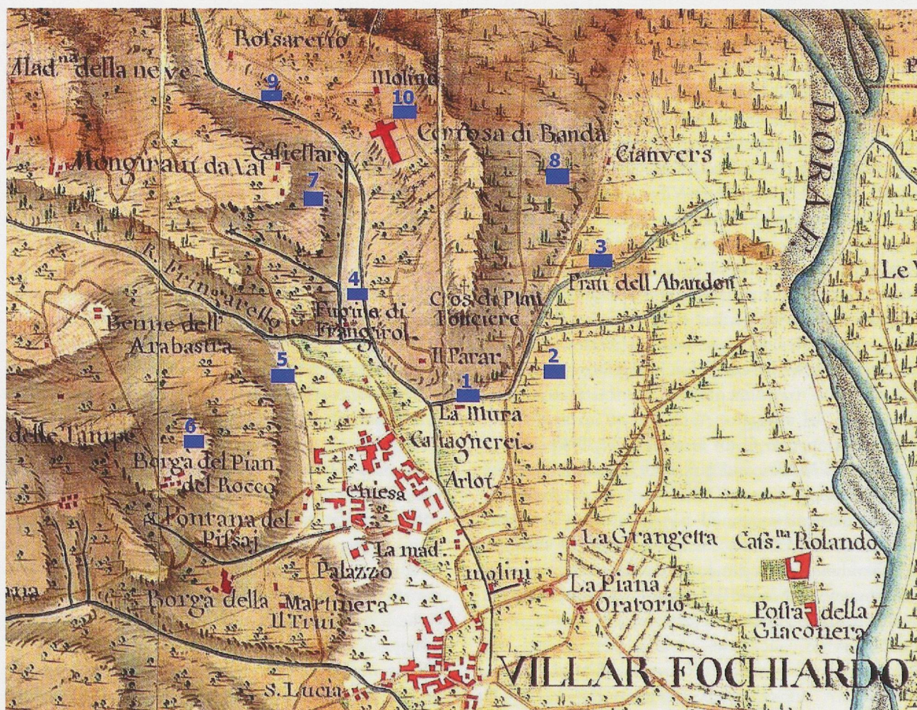
Fig. 7 - Tracciato della rete idrica (Visitatio 1557): area inferiore (Carta 1764-1772, Parte Settima).