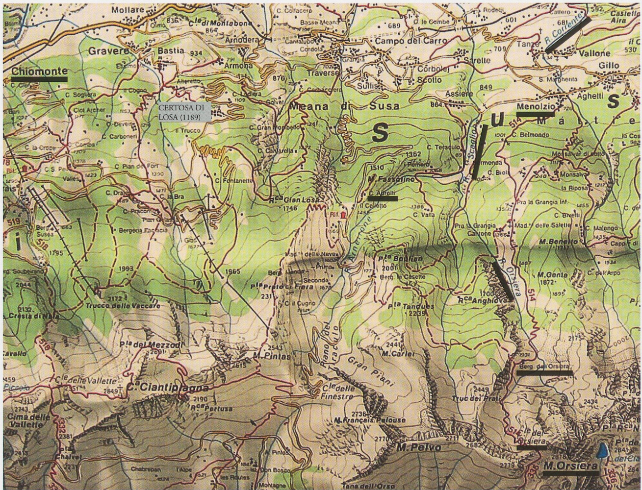
Fig. 1 – I confini dei “termini” della Certosa di Losa, tra “Orgevalle” e Valle Orsiera (Cartina 1 dell’Istituto Geografico Centrale, Val di Susa Val Chisone).

l’ormai noto rio Corrente, fino ai campi di Menolzio e fino al rio “de Iacernis”; poi (“deinde”) il corso di questo secondo rio, a partire dalla sommità dei monti; poi (“deinde”) la linea montagnosa che divide il comitato sabauda da quello grazianopolitano.