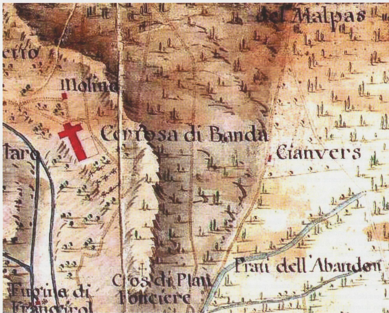
Fig. 5 - Il territorio di Banda, prima grangia e poi, da fine '400, nuova sede della Certosa (Carta della valle di Susa 1764-1772, Parte Settima, Archivio di Stato di Torino).