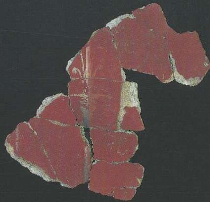
Motif de candélabre grêle dans la décoration du péristyle méridional de la pars urbana.

La villa romaine d'Orbe-Boscéaz acquiert son caractère palatial entre 161 et 180 de notre ère, lorsqu'est édifiée la vaste pars urbana à deux péristyles, avec son remarquable ensemble de mosaïques. Peu modifié au cours du temps, ce complexe résidentiel autorise, au travers de ses diverses composantes, une approche globale de sa conception architecturale et du programme décoratif qui la complète.