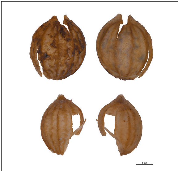
Fig. 185. Deux fruits de coriandre ( Coriandrum sativum ), vue dorsale à gauche, vue ventrale à droite.