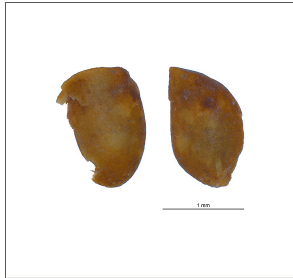
Fig. 186. Akènes de figes ( Ficus carica ), vue latérale à gauche, vue ventrale à droite.

Bad Nauheim en Allemagne, les deux espèces ont également été trouvées (Kreuz 2002; Kreuz et al. 2001). Des figes ont été découvertes dans les sites de Hochdorf/Enz en Allemagne, à proximité de la tombe d'un prince (Stika 1999) et dans le site marchand de Hengistbury Head dans le sud de l'Angleterre (Cunliffe 1987). Des restes de coriandre proviennent de trois sites datés de l'âge du Fer, deux situés en France: Saint-Julien-du-Sault et «Fossé des Pandours» au col de Saverne (Wiethold 2010) et un en Angleterre: l' oppidum de Silchester (Lodwick 2014). La rareté des deux espèces à l'âge du Fer et leur provenance méridionale soulignent l'importance probablement supérieure à la moyenne du site du Mormont et montrent que des contacts avec le monde méditerranéen existaient. Ceci est aussi démontré par la découverte de quelques dizaines de fragments d'amphores vinaires d'Italie ( cf. Mormont IV, à paraître).