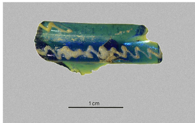
Fig. 53 – Fragment de bracelet côtelé en verre bleu à filets jaunes et blanc. 3 e -2 e siècle avant J.-C. Inv. AFo2-17