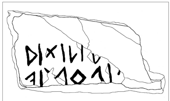
Fig.56 – Plaquette en schiste d'Argnou, comportant deux lignes d'inscription en alphabet de Lugano. ritili u[...] / [...]+ip ośa / - - - - (Inv. AF03-114). Dimensions 6,2 cm sur 3 cm. Echelle 1 : 2. Photographie Archéologie cantonale valaisanne, F. Wiblé. Dessin et transcription : F. Rubat Borel.