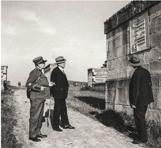
567 Die am westlichen Torpfeiler des Osttores (PE_M4) angebrachte Steintafel mit dem Grundriss des Tores wird begutachtet (1941).

Fensteröffnung an der Südseite von T2 den Wehrgang erschloss, wurde dieser Wiederaufbau für die Besucher zugänglich gemacht 1901 ■ 568.