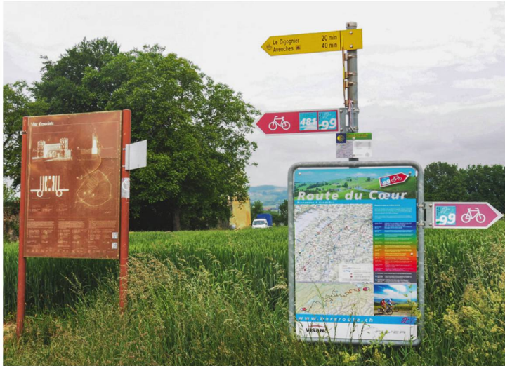
569 Ein «Wald» aus Informationstafeln: Die braune Tafel links vermittelt Informationen zum wenige Meter weiter westlich gelegenen Osttor.