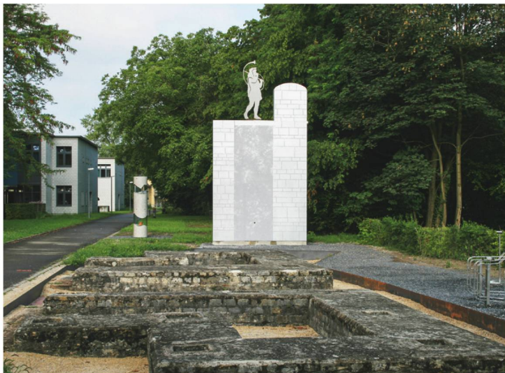
576 Legionslager Vindonissa. Visualisierung des Querschnittes der Lagermauer mit Hilfe eines Metallprofils. Im Vordergrund die Ruinen des Nordtors.