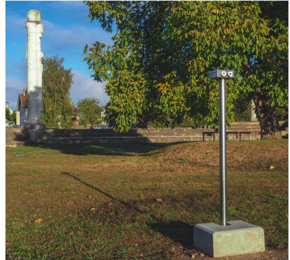
570 Stereoskop im Innenhof des Cigognier-Tempels.

obertägig sichtbaren Mauerteile ab den Teilstücken T20–T21_M1 ff. möglich wurde. Gerade der Erhaltung der wegen des rasch wachsenden Industriegebietes im Nordteil von Avenches stark bedrohten Blick- und Fluchtachsen der Stadtmauer kommt so eine grosse Bedeutung zu ■ 572.