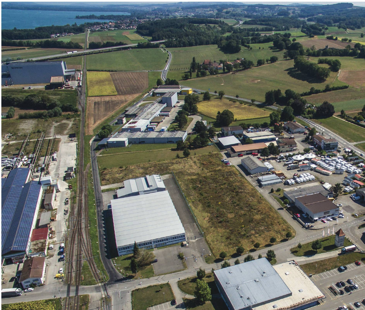
572 Industriezone Ost von Avenches: Während die oberhalb der Bildmitte gelegenen Bauten die Flucht der unmittelbar nördlich (d.h. links im Bild) verlaufenden Stadtmauer aufnehmen, brechen die im Vordergrund liegenden Gebäude vollständig mit deren Orientierung.

An diesen Fundplätzen wurden in der Vergangenheit archäologische Parks angelegt, die das antike Stadtgebiet und seine Befestigung mit gezielten Valorisierungsmassnahmen in die Thematik einer antiken Stadt einschlossen 1909 . Insbesondere in Xanten nimmt die Valorisierung der Stadtbefestigung einen wichtigen Teil der Vermittlungsbemühungen ein: Rekonstruktionsbauten von Tor- und Turmanlagen sowie rheinseitigen Kurtineabschnitten werden durch Hecken, welche den Verlauf der Kurtine darstellen ergänzt 1910 ■ 573, 574. Überlegungen zur Integration der Stadtmauer von Avenches in einen archäologischen Park wurden bereits in den frühen 1990er Jahren formuliert 1911 . Der Einbettung des kulturellen Erbes in den intakten Naturraum wurde