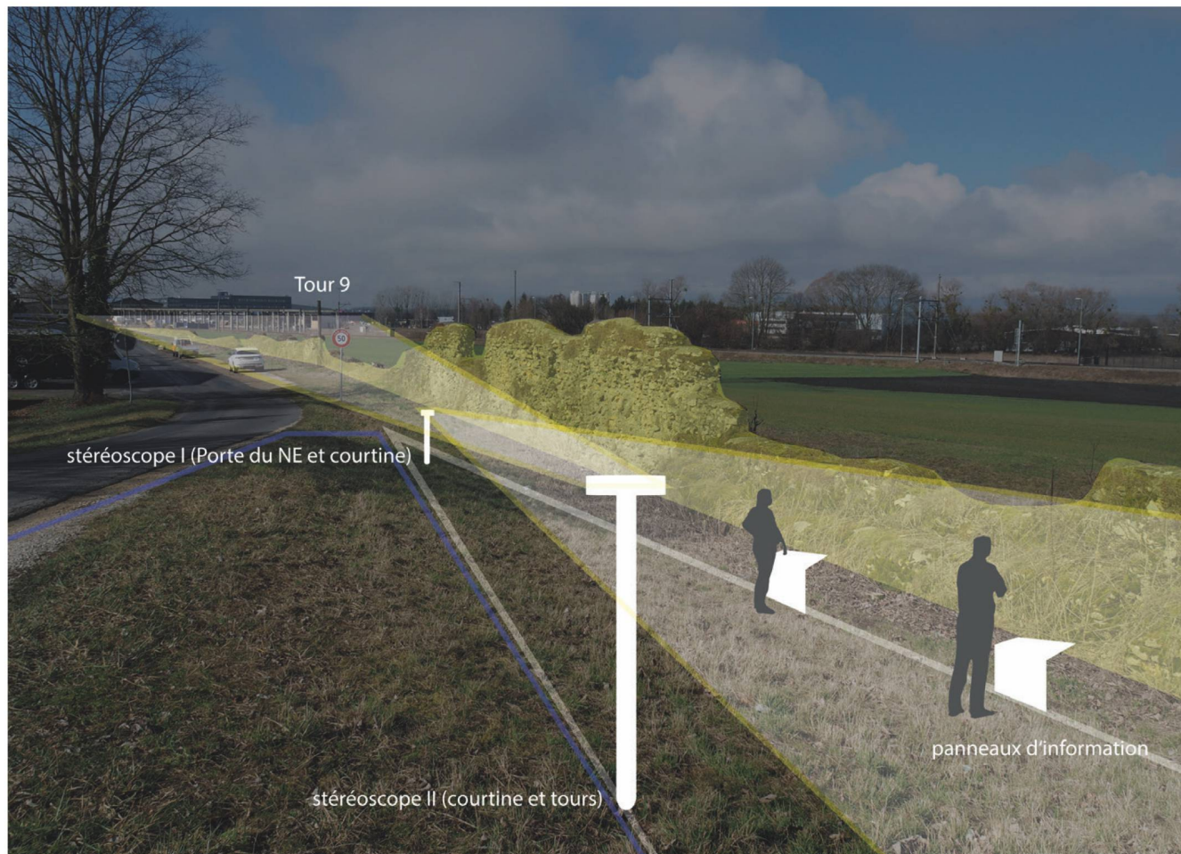
577 Visualisierung eines Informationspunktes am Nordosttor mit Stereoskopen und Informationspulten.

Eine verstärkte Valorisierung des Abschnittes T II bis zum Nordosttor böte die Möglichkeit, den ansonsten stark von einer West-Ost-Orientierung geprägten Rundgängen innerhalb der römischen Stadt eine attraktive, nord-südliche Alternative hinzuzufügen. Im Rahmen des aktuellen Restaurierungs- und Valorisierungsprojektes 1912 ist die Etablierung eines Informationspunktes am Nordosttor und dessen Anbindung an einen archäologischen Rundgang entlang der Innen- und Aussenseite der Stadtmauer bis zum Osttor angedacht ■ 577-579. Der Standort des Nordosttores ermöglicht es dem Besucher, die Stadtmauer gegen Süden und Nordwesten auf mehreren hundert Metern Länge zu verfolgen. Zudem kann hier die Siedlungstopographie innerhalb und ausserhalb der Stadt (Grabmonumente und Tempelbezirk von En Chaplix , villa suburbana von Le Russalet , Strassenverbin-