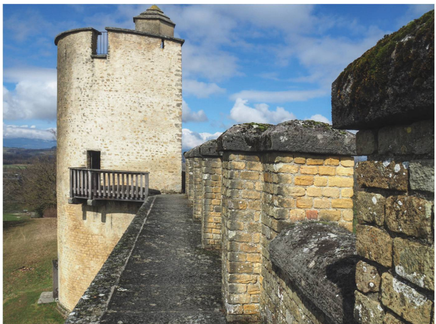
568 Der in den 1920er Jahren südlich von T2 wieder aufgebaute Wehrgang inklusive Brustwehr und Zinnenkranz.

Ab 2002 wurden im Rahmen einer allgemeinen Ausstattung der sichtbaren Monumente von Aventicum mit Informationstafeln auch solche an T2 und am Osttor platziert 1903 ■ 569. Anlässlich der ab 2016 laufenden Installation von Stereoskopen und neuen Informationspulten an den Monumenten der antiken Stadt sollen auch Teile der Stadtmauer, prioritär dabei das Osttor, sukzessive mit neuen, illustrativen Informationsträgern aufgewertet werden 1904 ■ 570. Im Frühjahr 2018 konnte schliesslich im Bereich einer um- und ausgebauten Sportplatzanlage der Stadt Avenches der Verlauf der Stadtmauer auf einer Länge von rund 135m markiert werden 1905 ■ 571. Dabei wurde die Mauer in ihrer Breite von 2.4 m mittels eines gelblich-beige eingefärbten Granulatstreifens auf dem neu eingebrachten Asphaltbelag angegeben. Zusätzlich sind die beiden innerhalb des betroffenen Perimeters liegenden Zwischentürme T23 und T24 in ihrem Grundriss dargestellt. Wichtig ist dabei, dass die Markierung der Stadtmauerflucht über den Bereich des Sportplatzes hinaus gegen Osten über die heutige Strasse ( Chemin du Milieu ) verlängert werden konnte, sodass hier ein optischer Anschluss an die