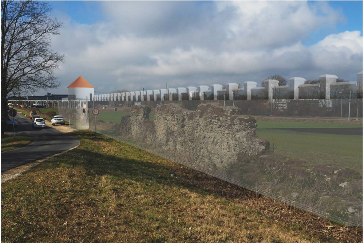
579 Visualisierung eines möglichen Stereoskop-Bildes für einen Informationspunkt zur Stadtmauer am Nordosttor. Die gegen Westen offene Blickachse ermöglicht das optische Verfolgen der Kurtine auf einer Länge von bis zu 300 m. Die transparente Darstellung der Rekonstruktion bietet dem Betrachter einen Bezug zu den heute noch sichtbaren Mauerresten.