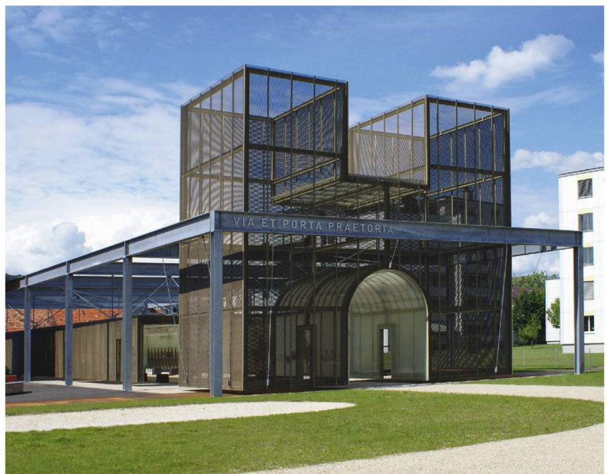
580 Das Südtor (Porta Praetoria) des Legionslagers Vindonissa in einer architektonischen Umsetzung des rekonstruierten Gebäudevolumens. Die aufgehängte Metallkonstruktion des Torvolumens versinnbildlicht die moderne Rekonstruktion, welche der antiken Ruine übergestülpt wird.