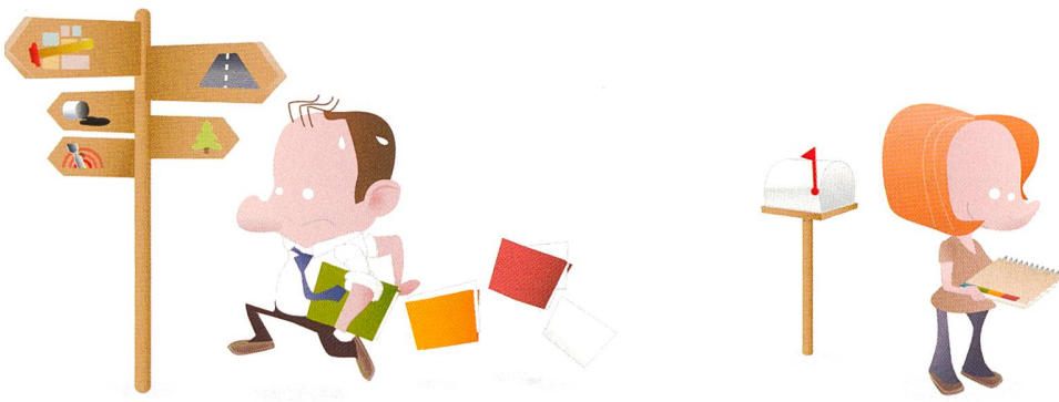
Abb. 2: Dank ÖREB-Kataster ist Schluss mit langen und aufwändigen Recherchen!

E-Government-Strategie des Bundes, die verlangt, die Verwaltungsabläufe effizienter zu gestalten, sie also einfacher und besser zugänglich zu machen. Die wirtschaftlichen Akteure wiederum können Zeit und Kosten sparen, denn sie werden dank des neuen Katasters sehr leicht auf die relevanten Informationen zum Grundeigentum zugreifen können. Zudem wird der ÖREB-Kataster die Rechtssicherheit erhöhen. Das Grundeigentum in der Schweiz ist mit Hypotheken von mehr als 700 Milliarden Franken, also über 100 000 Franken pro Einwohnerin und Einwohner belastet. Entsprechend hoch sind der Stellenwert von rasch verfügbaren, verlässlichen Informationen zum Grundeigentum und die wirtschaftliche Bedeutung dieses neuen Katasters, der die beiden anderen Säulen des schweizerischen Katastersystems (das Grundbuch und die amtliche Vermessung) ergänzt.