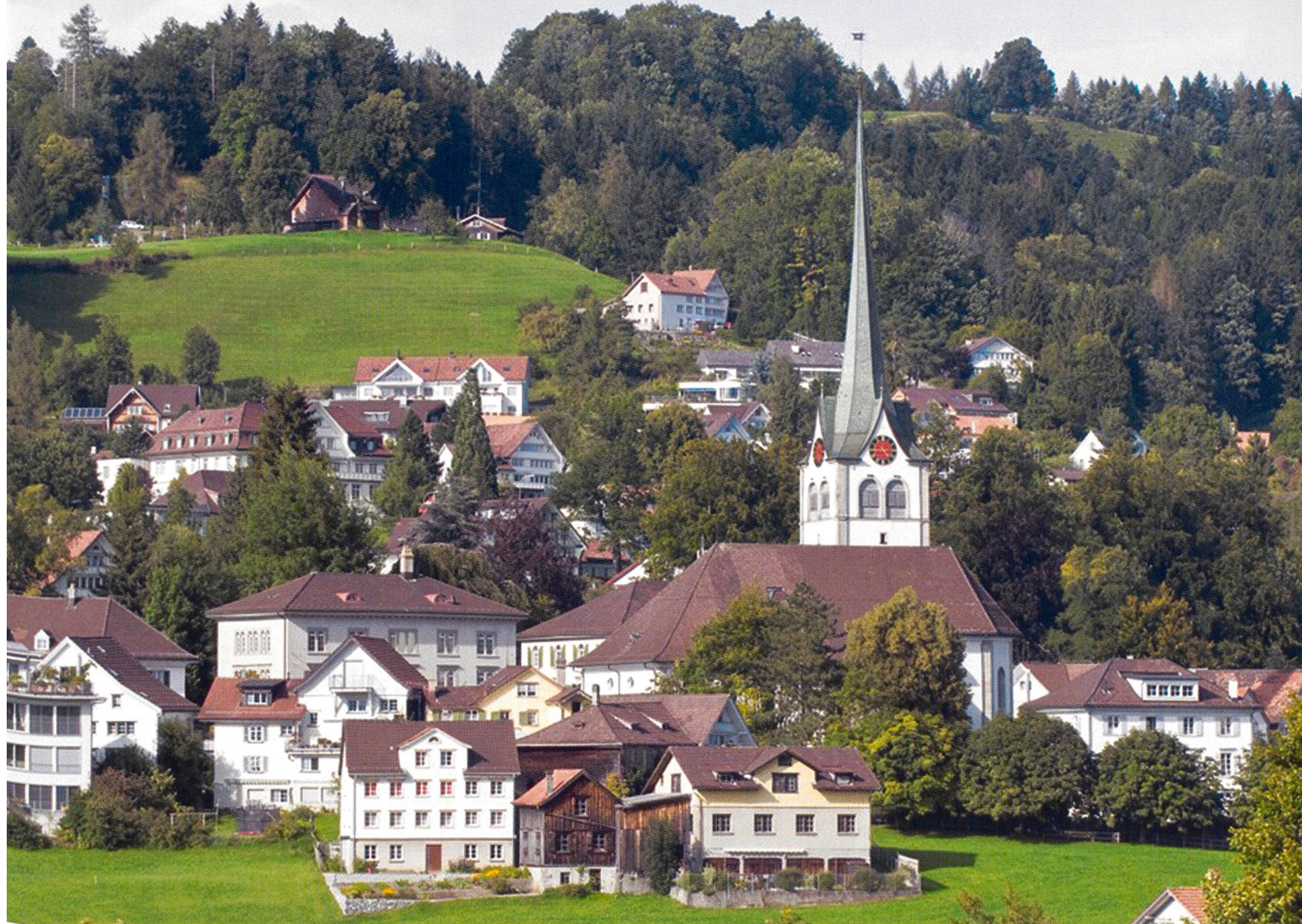
Abbildung: Dorfansicht Gemeinde Teufen (AR)

Im operativen Vermessungssystem des Geometers wurde zunächst eine parallele Datenschiene aufgebaut, welche die zu transformierenden Daten aufnehmen soll. Mit Hilfe von REFRAME – das Transformationsprogramm des Bundesamtes für Landestopografie zum Überführen der LV03-Koordinaten in LV95-Koordinaten – wurden dann sämtliche Koordinatenwerte auf allen Datenebenen des gesamten Vermessungswerkes innert kurzer Zeit umgerechnet und auf der neuen Datenschiene abgelegt. In der Mutationstabelle wurde sodann die entsprechende Gesamtmutation LV03 \Rightarrow LV95 eröffnet und angelegt. Während der Aufwand der Transformation des rechtsgültigen Vermessungswerkes gering war, erwies sich jedoch die Transformation pendenter Mutationen vergleichsweise als kostentreibend. Hier mussten zu jeder Mutation Folgemutationen eröffnet werden, in welcher nach Abschluss der eigentlichen Mutation der Bezugsrahmenwechsel nachgeholt wird. Genau diese Arbeiten sind sehr zeitintensiv, da 25 Mutationen zu diesem Zeitpunkt pendent waren. Projektbezogene Datensätze aus Privatarbeiten – wie z.B. aus der Bauvermessung oder Überwachungsmessungen – wurden nicht konvertiert. Diese wurden bzw. werden bis Abschluss noch im LV03-Operat bearbeitet.