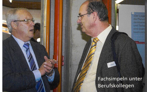
Fachsimpeln unter Berufskollegen