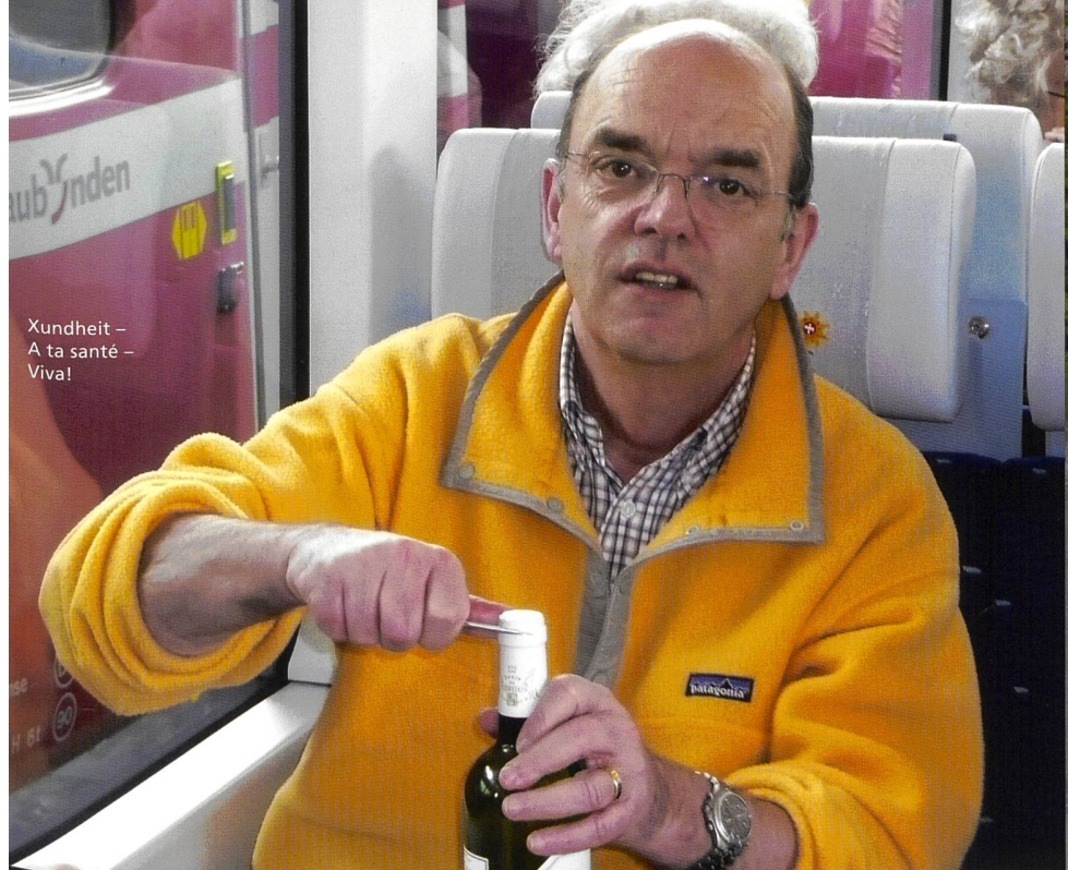
Kundheit – A ta santé – Viva!