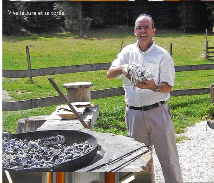
Vive le Jura et sa toréé