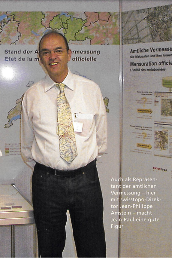
Stand der Amtlichen Vermessung Etat de la métadonnée officielle