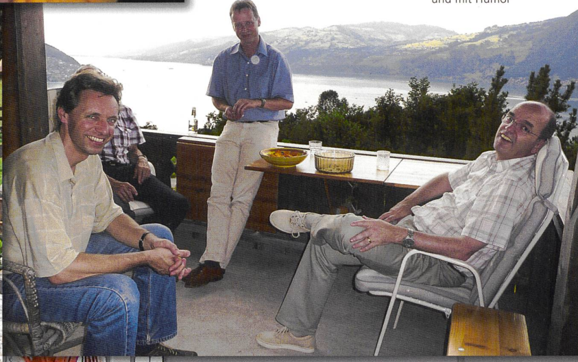
Relaxen mit Kollegen – und mit Humor