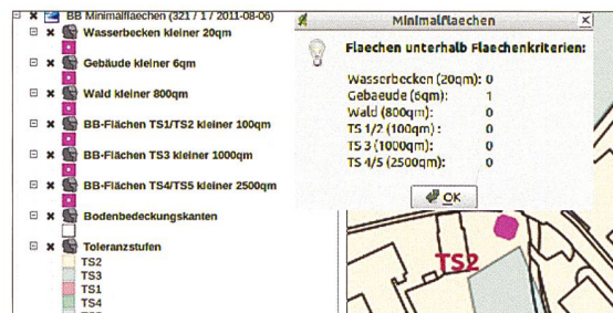
Abbildung 1: Kleinstflächen mit Hinweis in Pop-up-Fenster

Aufgrund des modularen und flexiblen Aufbaues wird die Verifikationsfachscha heute bereits für verschie-