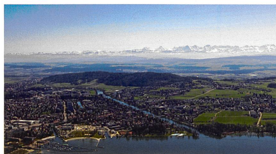
Magglingen, Durchführungsort des Staatsexamens für Ingenieur-Geometer/innen, bietet einen prächtigen Weitblick

Das Staatsexamen findet in den Räumlichkeiten des Bundesamtes für Sport in Magglingen statt.