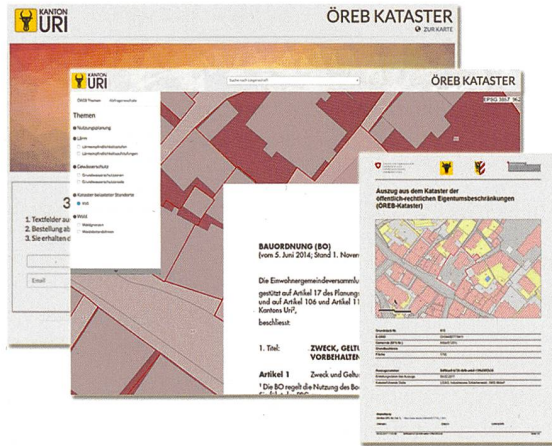
Abb. 2: Prototyp des kantonalen ÖREB-Katasterportals und Prototyp eines ÖREB-Katasterauszugs

Der Zugangsfokus im ÖREB-Katasterportal ist gemäss den Anforderungen des Bundes auf die Suche nach einer Parzelle (ergänzt um Lokalitäten wie Adresse etc.) ausgerichtet. Im Portal werden die Geobasisdaten und die Rechtsvorschriften zusammen mit den Beschlüssen, bezogen auf die ausgewählte Parzelle, zugänglich gemacht. Zusätzlich kann der Auszug aus dem ÖREB-Kataster direkt generiert werden. Projektierte ÖREB-Katasterdaten können optional dazu geschaltet werden.