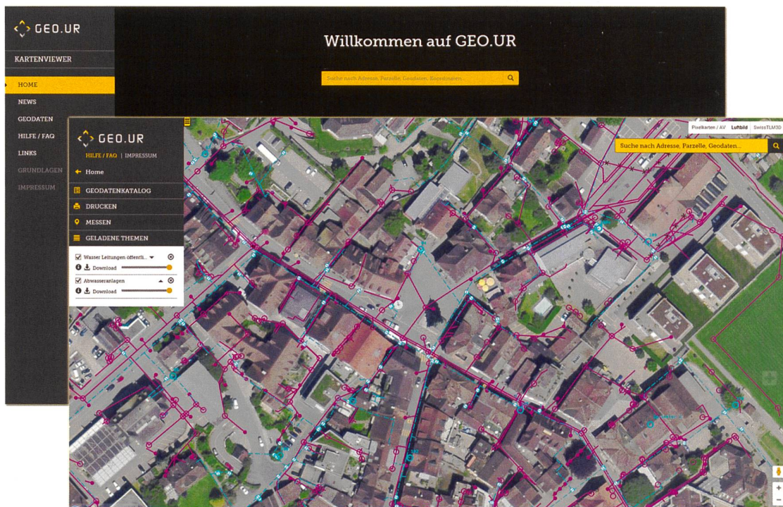
Abb. 1: Geoportal GEO.UR

staltungspläne (QP/QGP) sowie weitere, durch die Nutzungsplanung nicht erfasste Baulinien des Kantons und der Gemeinden.