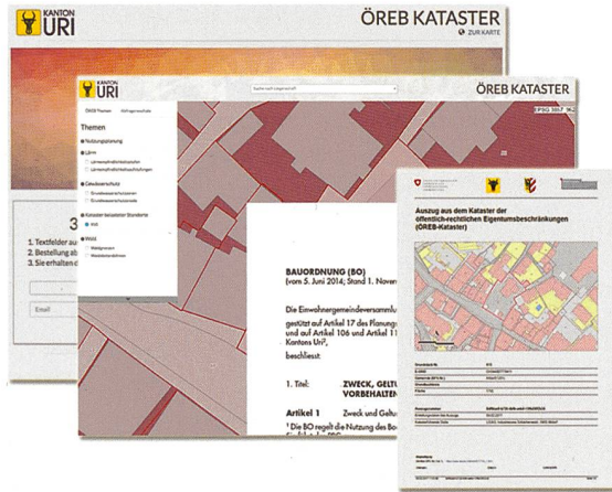
Abb. 2: Prototyp des kantonalen ÖREB-Katasterportals und Prototyp eines ÖREB-Katasterauszugs

Der Zugangsfokus im ÖREB-Katasterportal ist gemäss den Anforderungen des Bundes auf die Suche nach einer Parzelle (ergänzt um Lokalitäten wie Adresse etc.) ausgerichtet. Im Portal werden die Geobasisdaten und die Rechtsvorschriften zusammen mit den Beschlüssen, bezogen auf die ausgewählte Parzelle, zugänglich gemacht. Zusätzlich kann der Auszug aus dem ÖREB-Kataster direkt generiert werden. Projektierte ÖREB-Katasterdaten können optional dazu geschaltet werden.