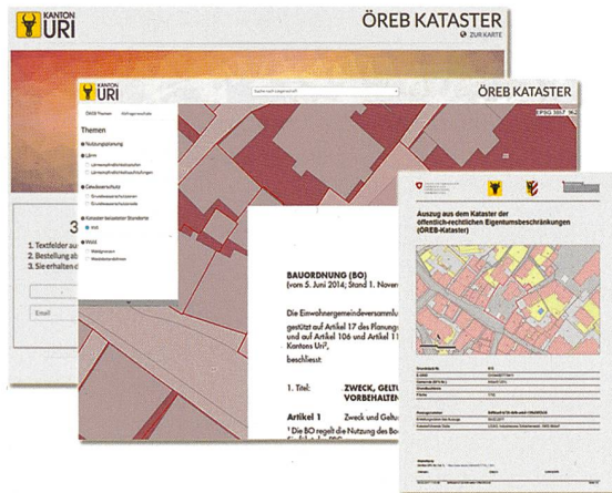
Abb. 2: Prototyp des kantonalen ÖREB-Katasterportals und Prototyp eines ÖREB-Katasterauszugs

Der Zugangsfokus im ÖREB-Katasterportal ist gemäss den Anforderungen des Bundes auf die Suche nach einer Parzelle (ergänzt um Lokalitäten wie Adresse etc.) ausgerichtet. Im Portal werden die Geobasisdaten und die Rechtsvorschriften zusammen mit den Beschlüssen, bezogen auf die ausgewählte Parzelle, zugänglich gemacht. Zusätzlich kann der Auszug aus dem ÖREB-Kataster direkt generiert werden. Projektierte ÖREB-Katasterdaten können optional dazu geschaltet werden.