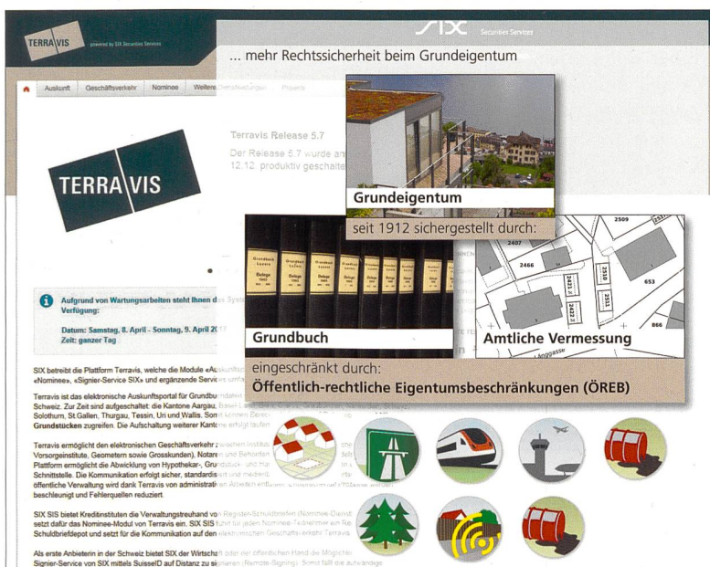
Abb. 1: Zusammenführung der beteiligten Daten im Auskunftssystem

Der Kanton Nidwalden kann gemäss der gesetzlichen Grundlage (Art. 27 Abs. 1 GBV 2 ) die ohne Interessennachweis einsehbaren Daten des Grundbuchs im Internet für elektronische Auskünfte und zur Einsichtnahme