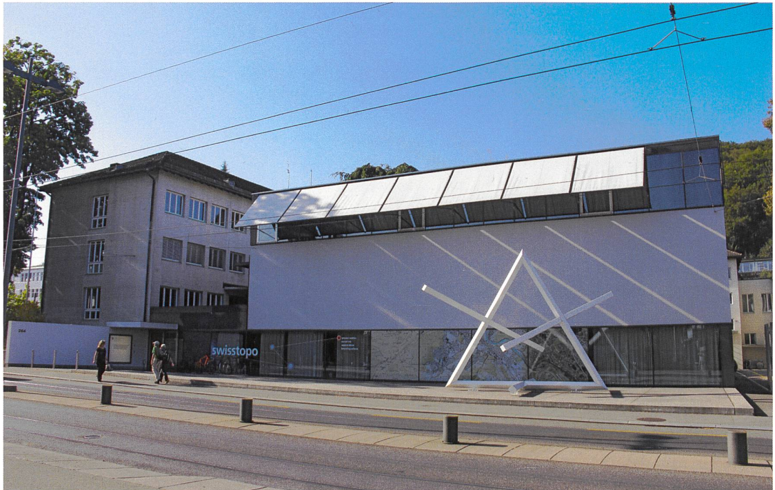
Abb.: Das Bundesamt für Landestopografie swisstopo an der Seftigenstrasse 264, 3084 Wabern

Vor gut einem Monat war es soweit: Die Mitarbeitenden der vormaligen Eidgenössischen Vermessungsdirektion zügelten nach knapp drei Jahren aus den Räumlichkeiten im Eidgenössischen Institut für Metrologie METAS am Lindenweg 50 in Wabern wieder zurück an die Seftigenstrasse 264, an den Hauptsitz des Bundesamtes für Landestopografie swisstopo.