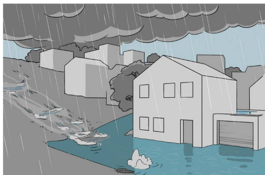
Abb. 1: Lokale Starkregen bringen innert Minuten mehr Wasser, als die Entwässerungseinrichtungen zu fassen vermögen. Zwei von drei Gebäuden in der Schweiz sind potentiell von Oberflächenabfluss gefährdet.

Oft genügen herkömmliche Planungsansätze und die begrenzte Betrachtung einzelner Projektperimeter nicht mehr, um weitsichtige Lösungen zu entwickeln. Der Klimawandel ist ein gutes Beispiel für solch hochkomplexe Veränderungen, die ein interdisziplinäres und auf über-