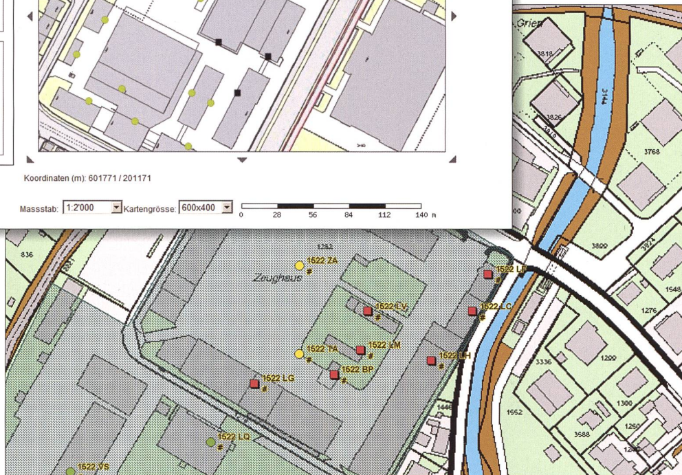
Figure à droite: Représentation d'objets et de périmètres sur fond de WMS MO

ment nécessaire pour que ces masses de dossiers puissent être traitées en temps et en heure. Sans cette possibilité, armasuisse Immobilier serait dans l'incapacité d'assumer l'éventail des tâches qui lui incombent en tant que plus important gestionnaire immobilier de Suisse.