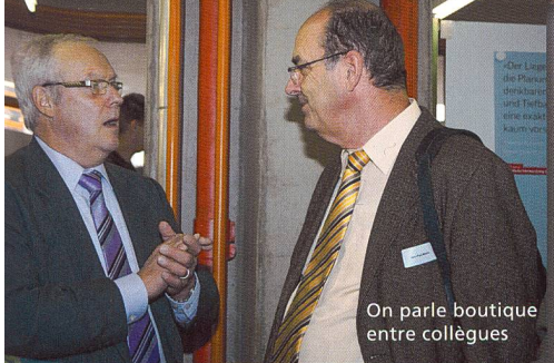
On parle boutique entre collègues