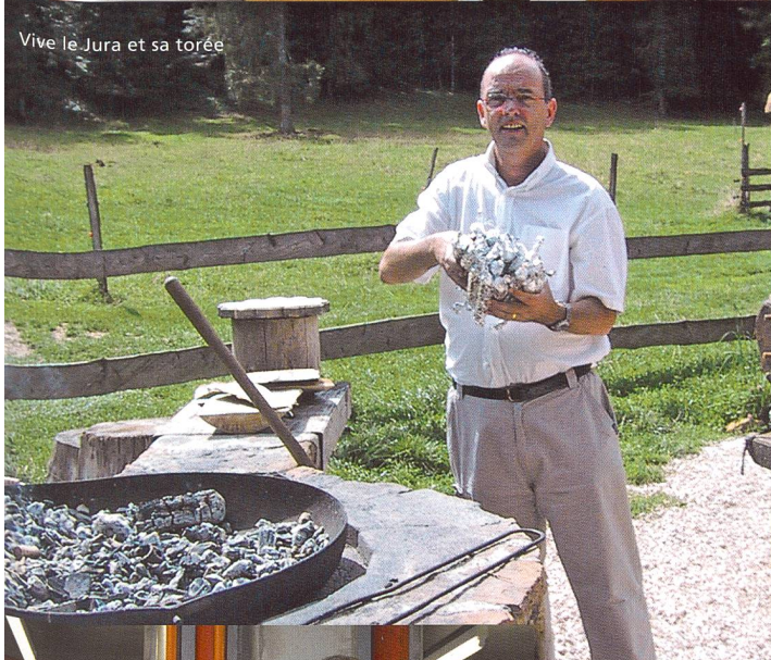
Vive le Jura et sa torée