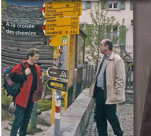
A la croisée des chemins