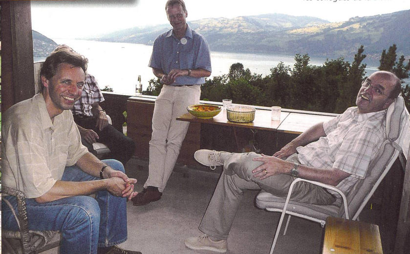
Moment de détente avec les collègues de la D+M