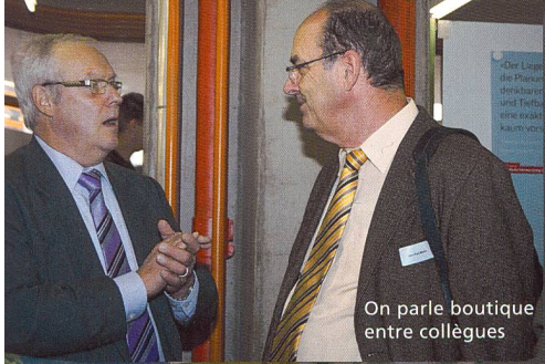
On parle boutique entre collègues