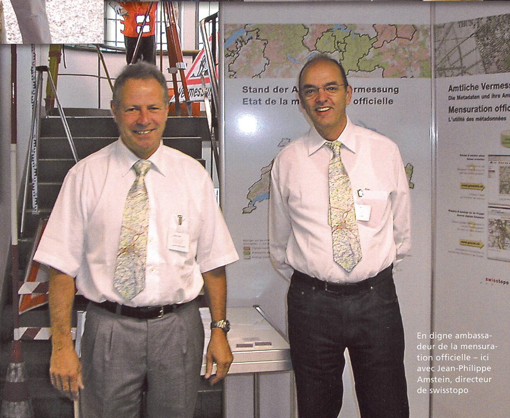
Stand der Amtlichen Vermessung Etat de la mensuration officielle