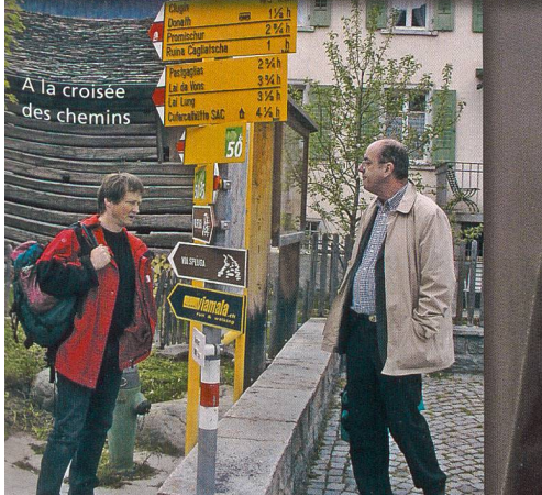
A la croisée des chemins