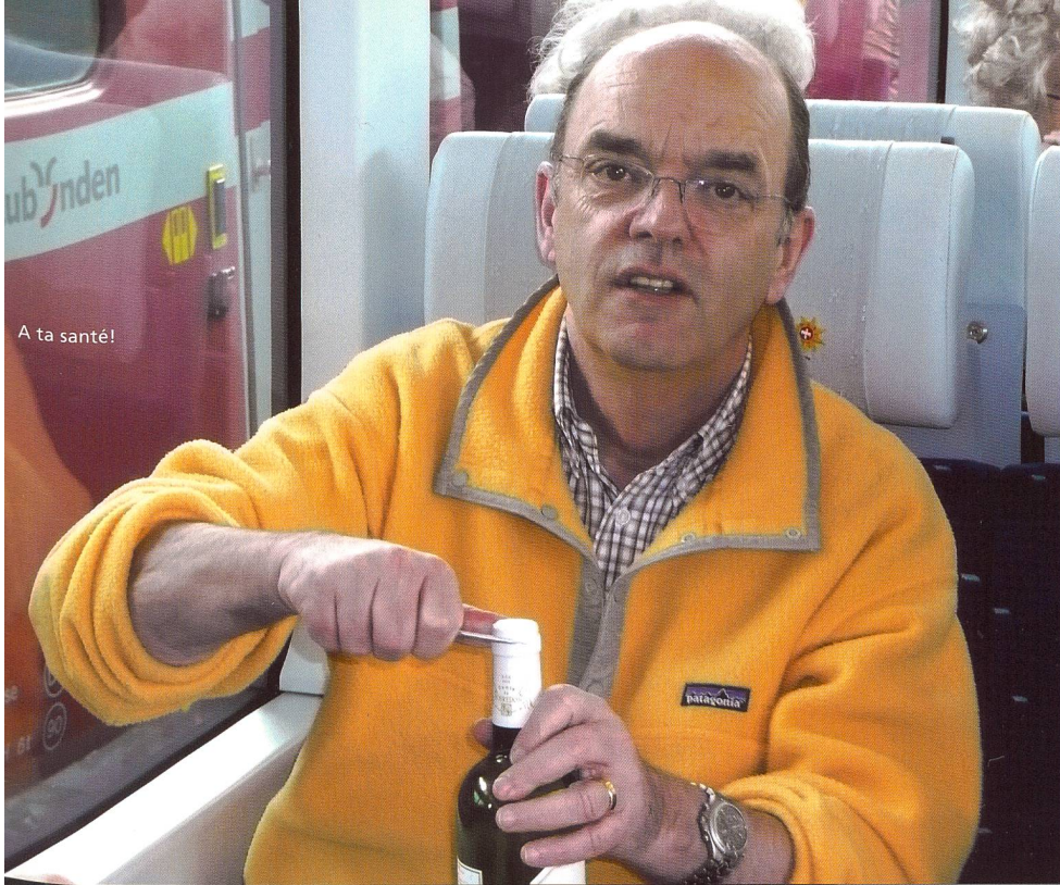
A ta santé!