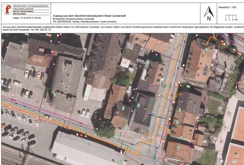
Figure: A titre d'exemple, un extrait du cadastre des conduites du canton de Bâle-Campagne, avec le plan de base de la mensuration officielle comme arrière-plan (en haut) ou une orthophoto (en bas)

les raccordements des bâtiments. L'intervalle de livraison minimal des données par les propriétaires de réseaux va de un à trois mois.